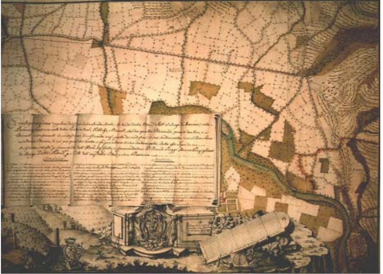
Arch. Molino, rilievo della "Strada Reale" Archivio di Stato di Torino, Corte, Carte Topografiche, Serie III, Asti 1, Inv. 252

Professionista zelante, Molino è attivo anche presso alcune comunità civili del Monferrato: progetta e realizza le parrocchiali di Aramengo e di Brusasco, rileva quelle di Moncucco e di Santo Stefano Belbo.