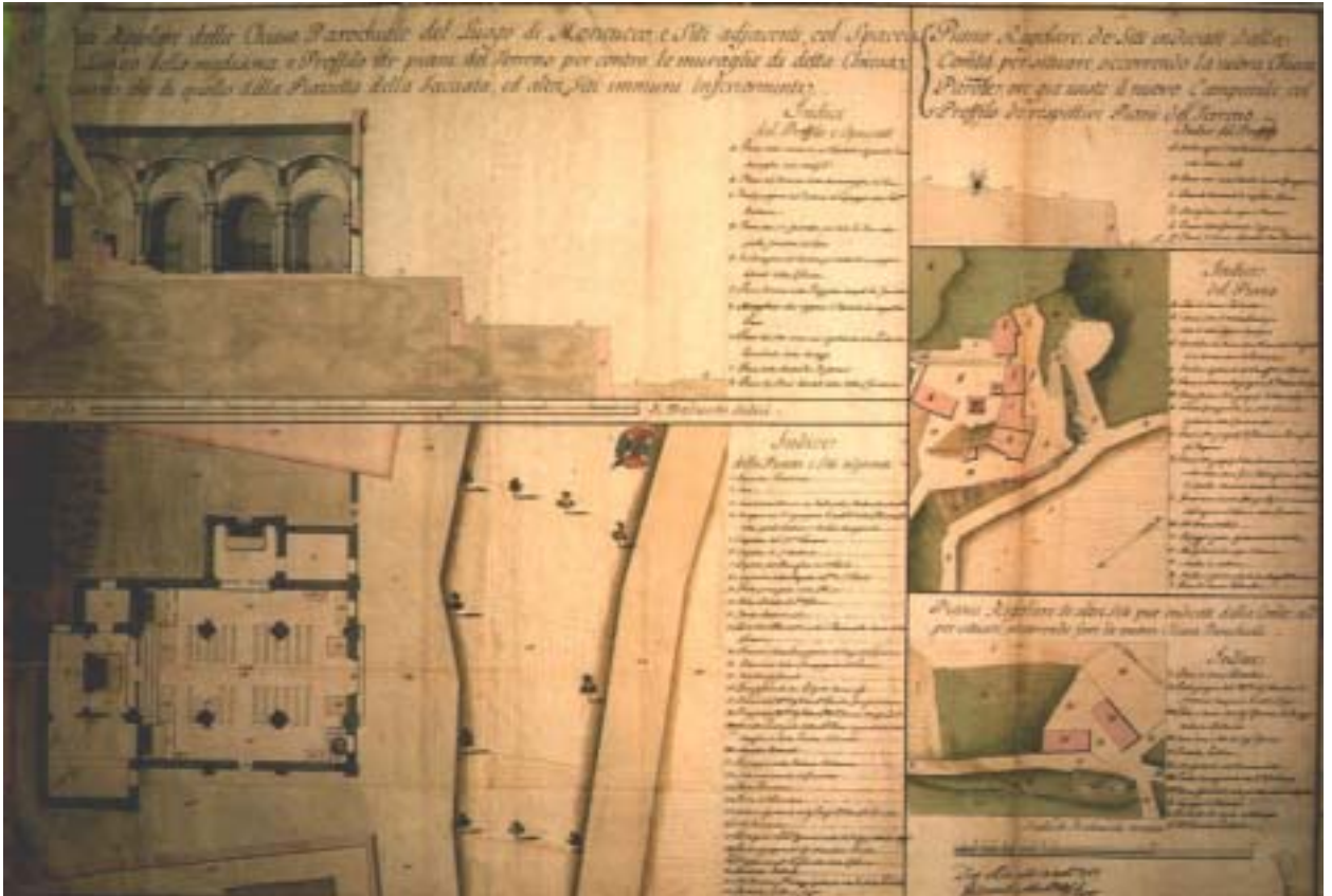
Arch. Molino, rilievo della parrocchiale antica di Moncuoco Archivio di Stato di Torino, Corte, Carte Topografiche, Serie III, Moncuoco 1

L'architettura di Molino rientra negli schemi della tradizione piemontese settecentesca, caratterizzata dagli importanti contributi di Guarini, Juvarra e Alfieri.