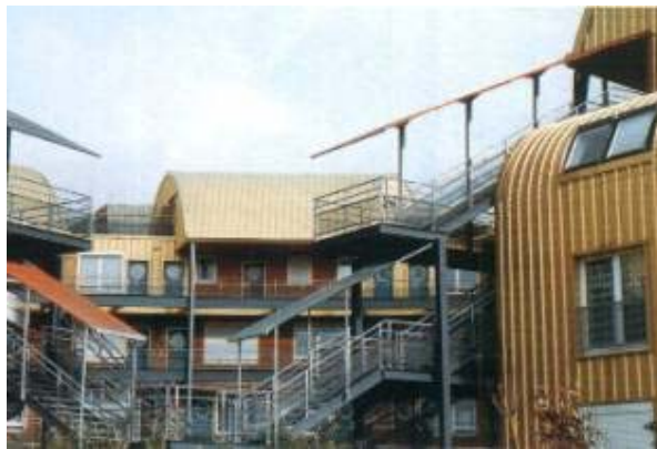
Edificio assemblato a secco: Kronos a Nantes (Arch. Dubosc e Landowski)