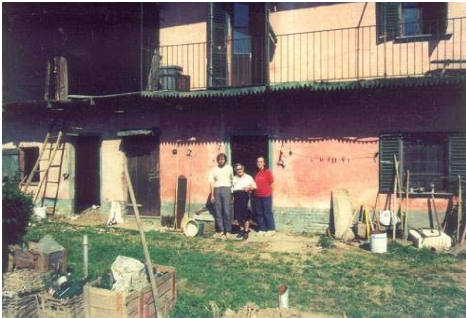
Indagine sul campo.

Il nostro contributo si compone per una parte consistente della ricerca sul campo ma anche di una prima analisi delle figure fantastiche ricorrenti e degli elementi simbolici emersi che maggiormente sono risultati correlati con elementi del territorio e del paesaggio, proponendosi così di tentare di delineare una sorta di geografia dell'immaginario nella nostra area di pertinenza, la provincia cuneese.