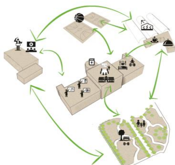
Concept di progetto del complesso della Fondazione Pacchiotti.

Tutte le fasi e le funzioni del progetto sono concepite ad una scala più ampia, come integrale nelle attività del limitrofo liceo Blaise Pascal ed altrettanto in quella della città di Giaveno.