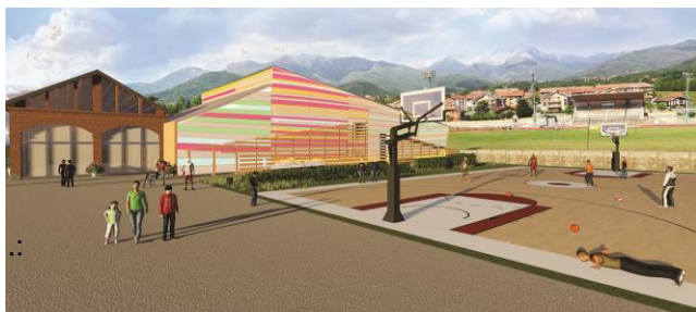
Render vista Auditorium e campi sportivi .