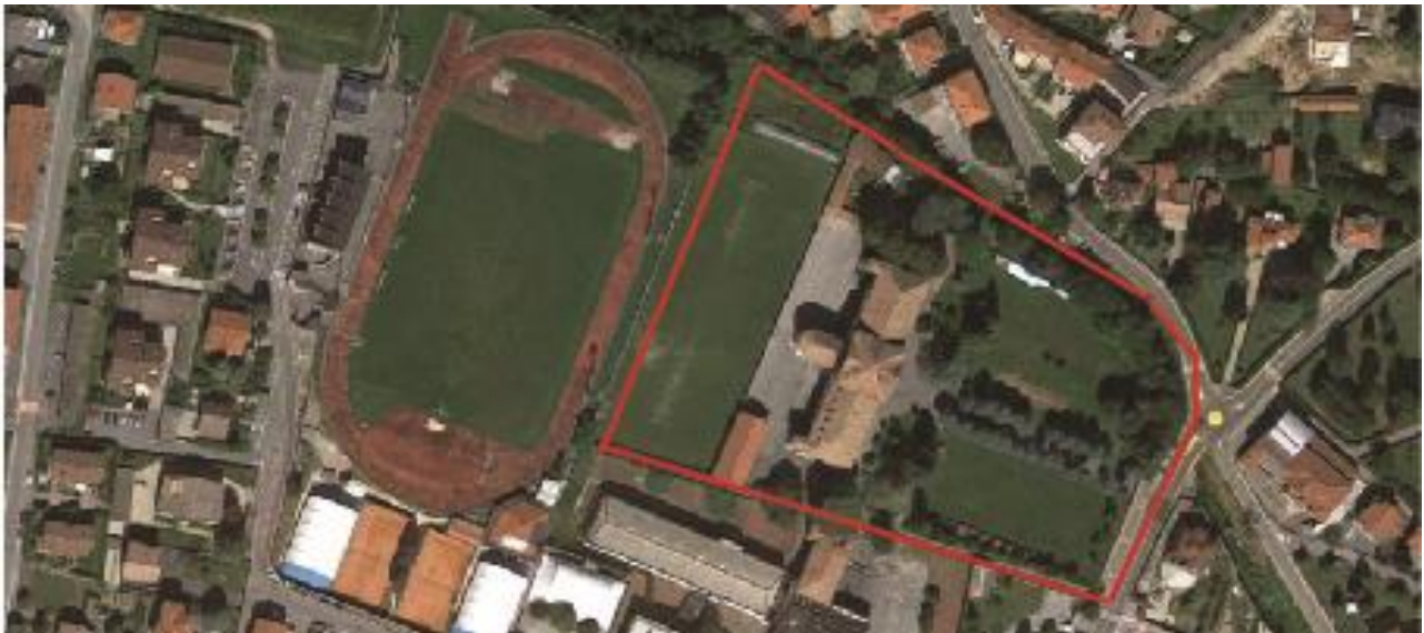
Foto satellitare, evidenziata in rosso l'area d'intervento.

L'attuale eterogeneità e molteplicità di destinazione d'uso, in certi casi disomogenee e non congrue con la missione educativa a cui la Fondazione è votata statutariamente, ha condotto analisi precedenti il progetto che hanno portato a formulare una riorganizzazione ed una razionalizzazione funzionale dell'intero edificio.