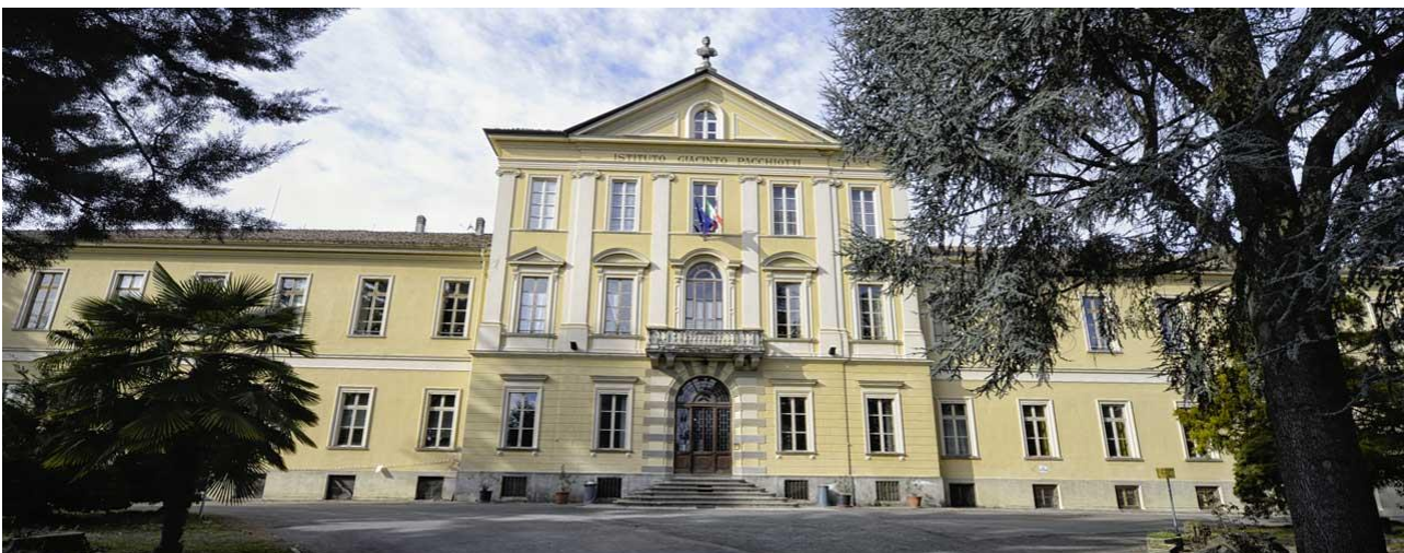
Ingresso principale dell'Istituto Giacinto Pacchiotti.