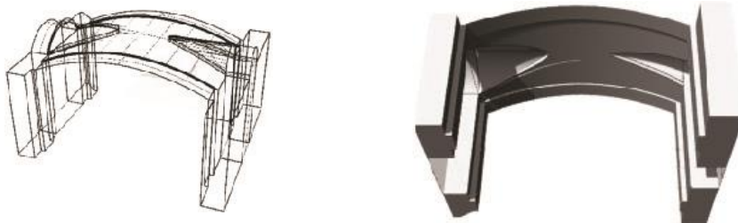
Esempio di ricostruzione 3D delle volte.

Si è anche analizzata la struttura portante e le volte presenti nell'edificio; quest'ultime poi sono state restituite con grafiche 3D per studiarne la geometria.