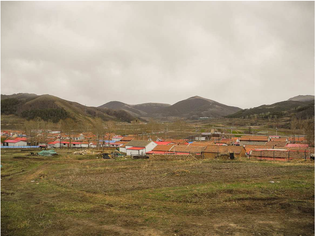
Fotografia del villaggio agricolo Taizicheng, Chongli (China). Gli edifici esistenti verranno smantellati per la realizzazione di uno dei futuri villaggi olimpici di Beijing 2022.