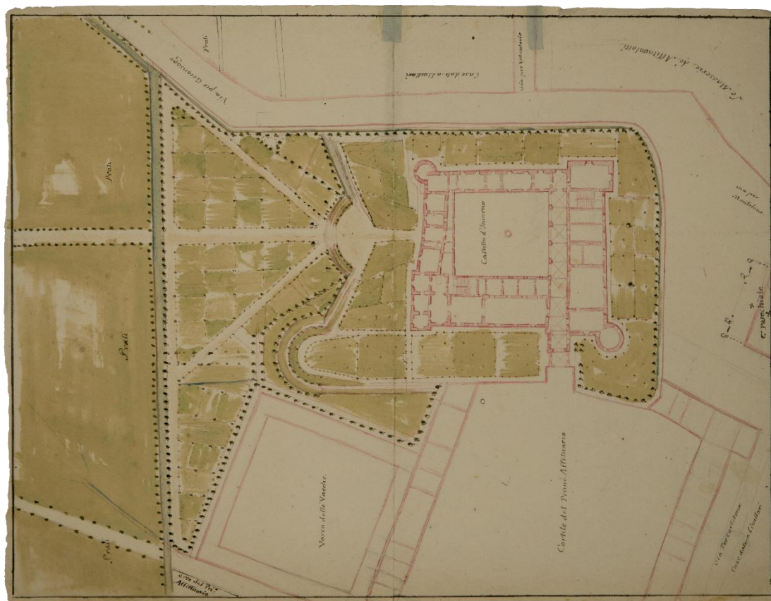
Disegnatore Anonimo, Pianta del Castello d'Inverno con relativo parco, Disegno su carta, 412x319 mm, seconda metà del XVIII secolo, FAI, Castello di Masino, Fondo Disegni, I/288.