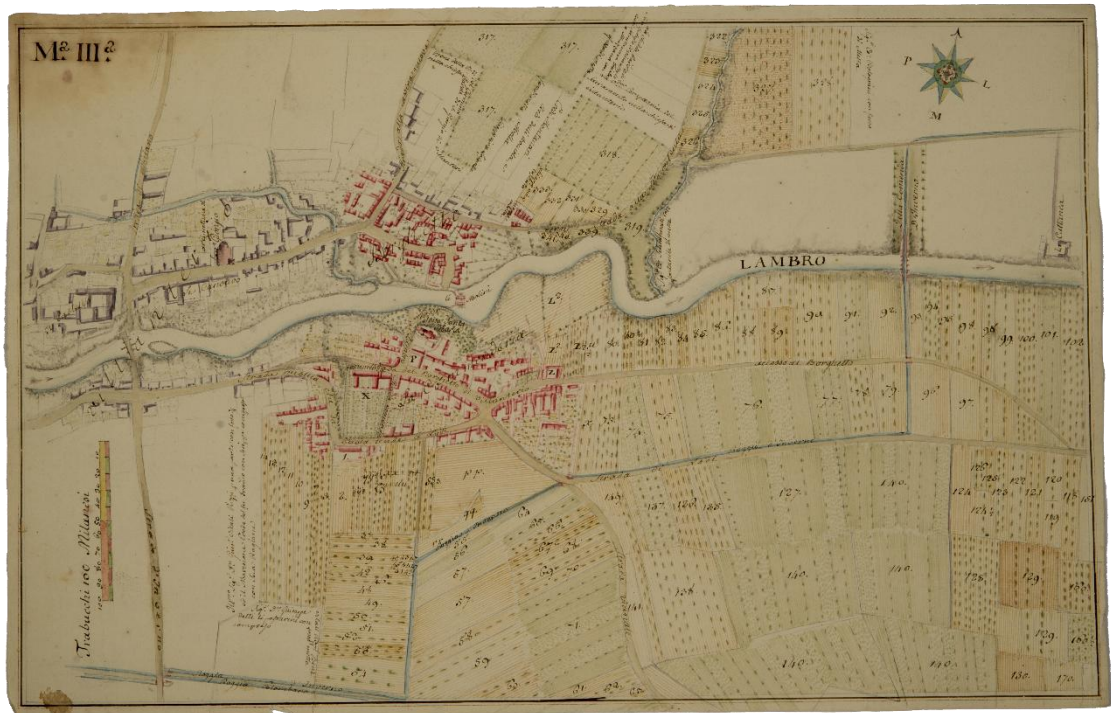
Disegnatore anonimo, Mappa del territorio di Borghetto di Villanterio, Disegno su carta, 285x442 mm, seconda metà XVIII sec., FAI, Castello di Masino, Fondo Disegni, I/293.