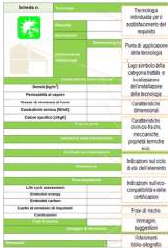
Esempio di schede tecnologiche

mercato, ma riporta alcuni esempi che possono fungere da punto di partenza per l'elaborazione di un progetto tecnologico concreto.