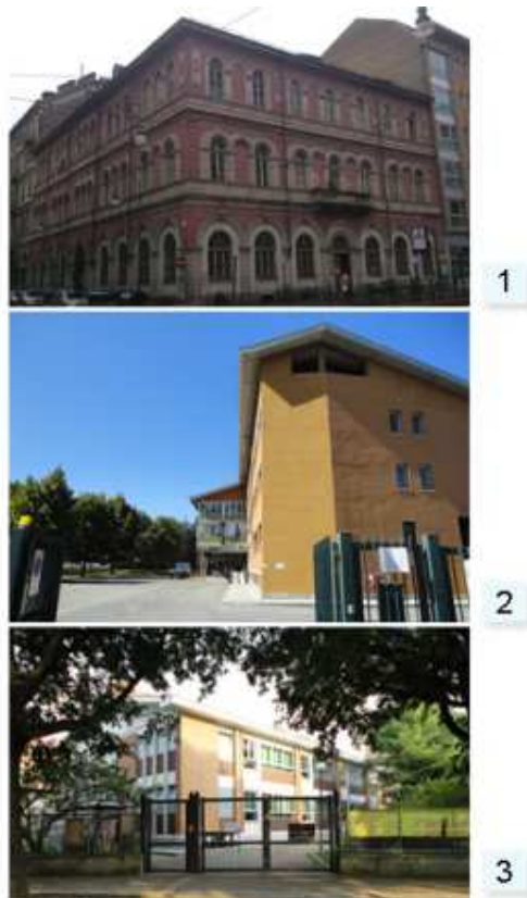
Le tre scuole torinesi

In questo contesto è riscontrabile il progetto Pro_Lite ; un'iniziativa europea, introdotta all'interno del programma Torino Smart City , che affianca al progetto tecnologico innovativo, il progetto del comfort e del benessere psico-percettivo dell'utenza scolastica. La mia ricerca ha portato all'individuazione di tre soluzioni progettuali rispondenti alle recenti normative ed ai progetti internazionali sopra citati al fine di riqualificare uno dei tre edifici scolastici cittadini interessati dal progetto europeo: la scuola primaria Riccardo Dal Piaz .