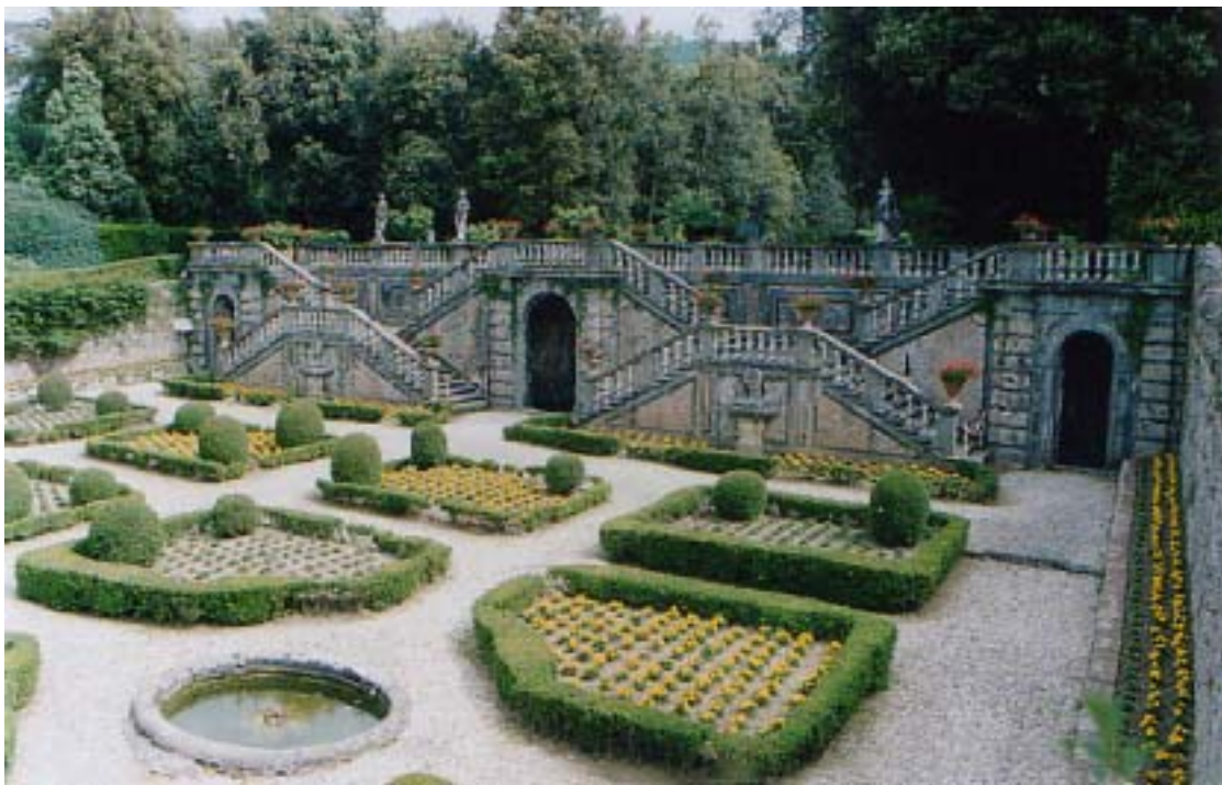
Il Giardino di Flora: lo scalone

Oggetto della presente tesi è lo studio del Giardino “segreto” di Flora, comparto di un più ampio disegno di palazzo e giardini di matrice seicentesca che danno forma ad un complesso sistema territoriale qual è Villa Torrigiani oggi Colonna a Camigliano. Il processo di formazione dell’invaso mistilineo maturato a partire dal ribaltamento delle forme della “chiusa” rispetto all’asse nord-sud individuato dallo sviluppo della peschiera, la favorevole localizzazione della proprietà allora Buonvisi tra due corsi d’acqua, il rio Dezza e il rio Gomboraio, la collocazione del giardino addossato al primo tra quelli e a quota inferiore rispetto al piano di campagna dello spazio circostante per una più logica razionalizzazione e sfruttamento delle acque, il culmine compositivo individuabile nel ninfeo dei venti, favoriscono il connotarsi del luogo come regno delle acque: un profondo e caratterizzato processo di appropriazione e qualificazione della campagna, nel duplice, stretto e complesso legame di controllo-dipendenza tra il territorio e l’insediamento.