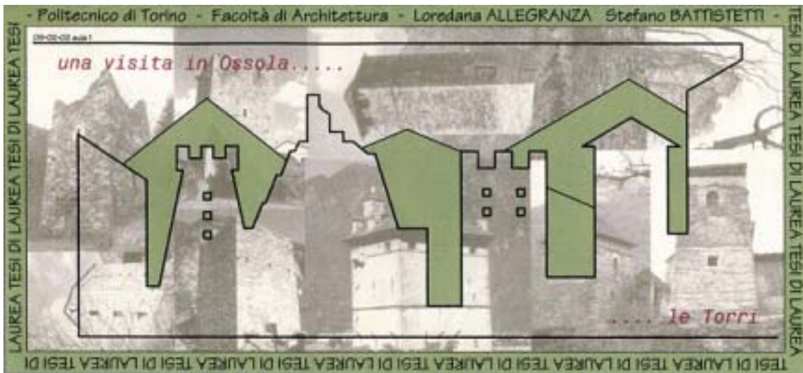
Logo elaborato per la presentazione della Tesi