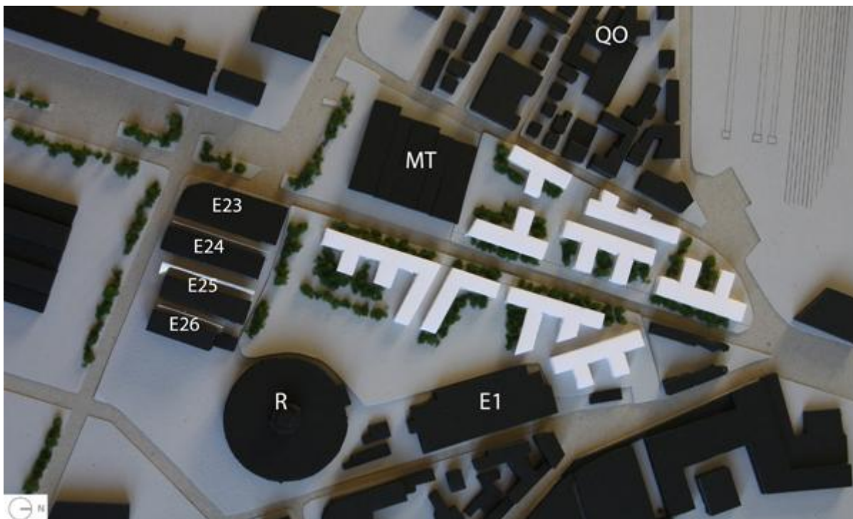
Modello in scala 1:2000 della proposta urbanistica finale

Successivamente, alla scala degli edifici è stata proposta un'alternativa alla funzione di polo bancario, attualmente prevista dal Comune, tenendo conto dell'importanza degli utenti e della città come espressione di vita sociale che deve contenere edifici pubblici aperti e multifunzionali, per ora assenti a Verona Sud. Il progetto vuole restituire questi spazi alla città eliminando la monofunzionalità e inserendovi un centro polifunzionale, che attragga con attività differenti le utenze più svariate. All'interno si trovano così spazi espositivi, spazi commerciali, di ristoro, palestra, spazio destinato al teatro, spazi per la danza, coworking, biblioteca, zone per bambini, spazi per proiezioni audiovisuali.