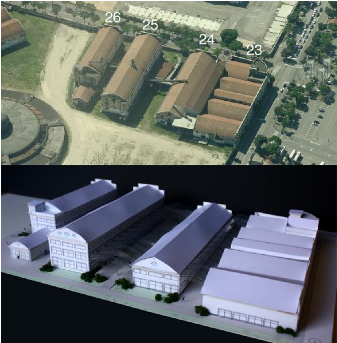
Edifici stato attuale – Modello edifici stato di progetto

Concludendo, si ritiene lodevole l'iniziativa di riuso da parte del Comune, ma occorre fare attenzione a non ricadere nello stesso problema che si sta cercando di risolvere: la zonizzazione monofunzionale. Inserire un vasto spettro di funzioni è anche un modo per ripartire il rischio su più attori: se fallisce uno lascia il proprio posto ad un altro, meccanismo non così automatico nel caso di un unico attore coinvolto. Il mix funzionale permette così di garantire il successo dell'intervento a lungo termine.