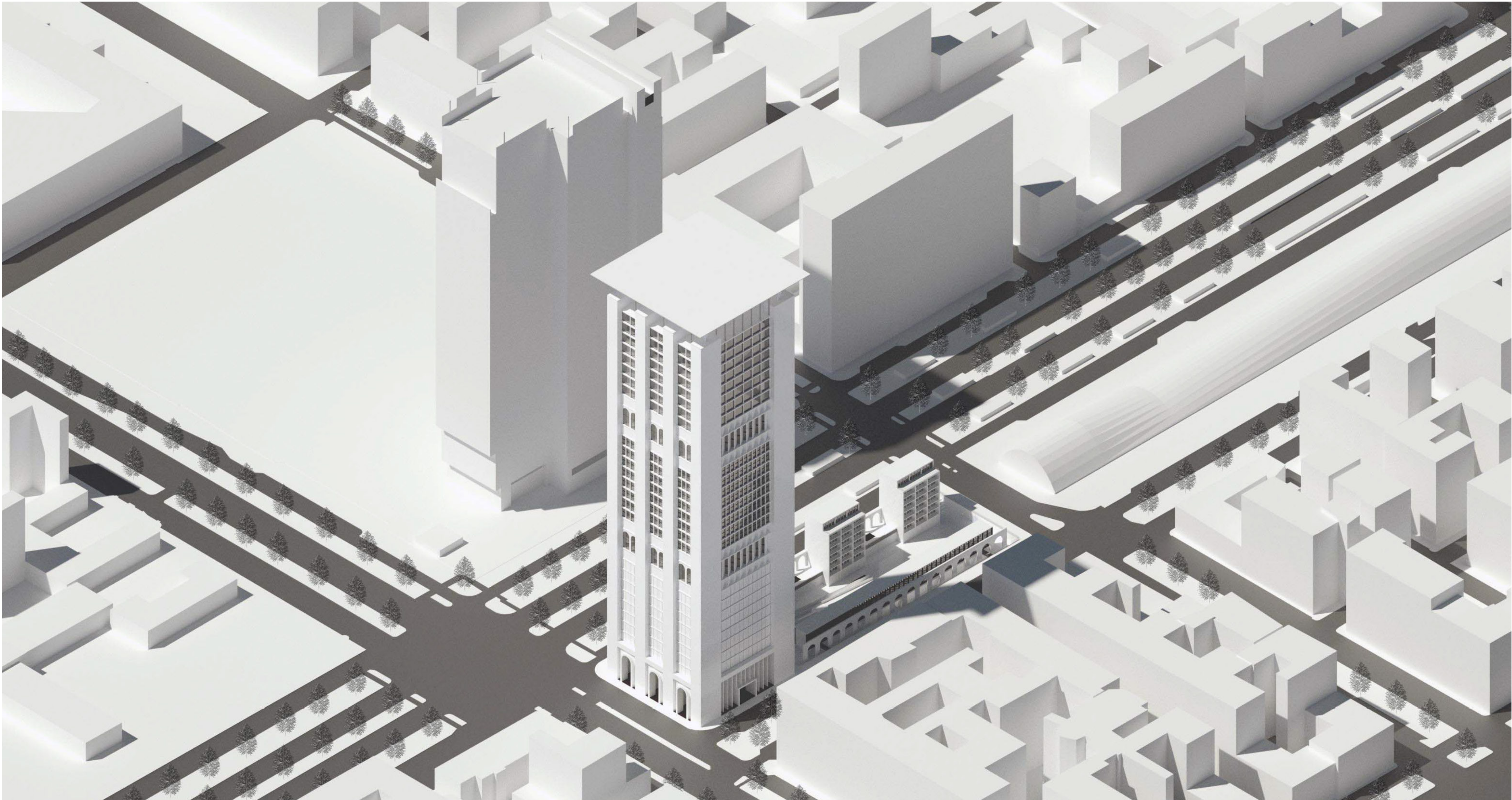
Vista assonometrica sull'area di progetto e sul suo contesto