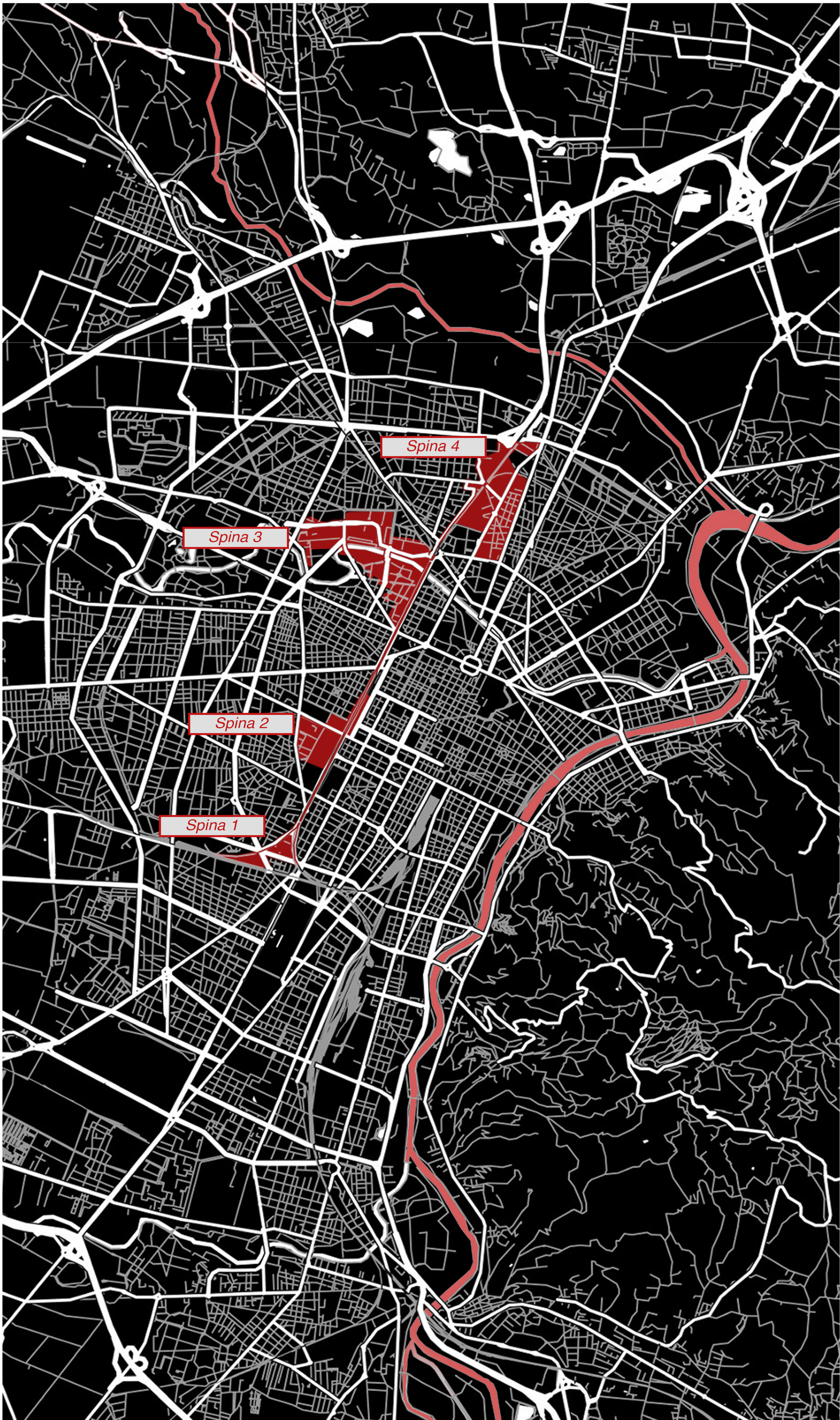
Individuazione della "Spina centale" - area di progetto in Spina 2