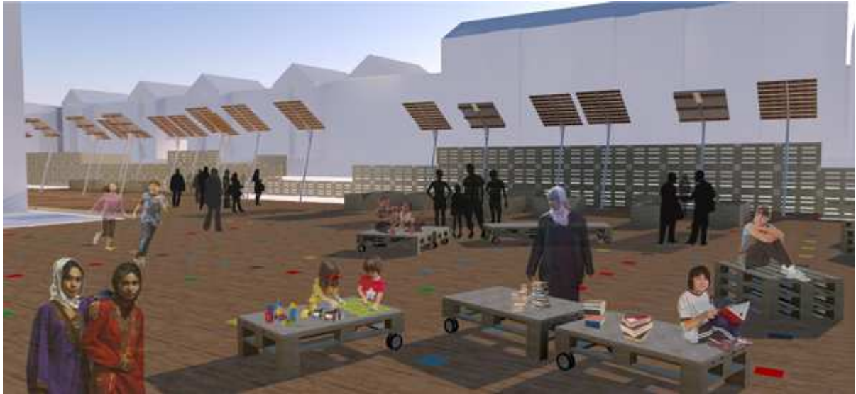
Imagen del area proyectual

Para más informaciones, e-mail: Alberto Fontana: fontana.lrt@gmail.com