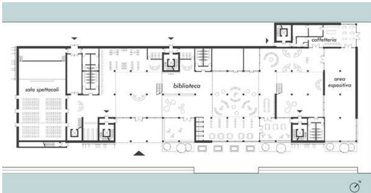
Marina cultural centre: pianta piano terra

La distribuzione degli ambienti vede una chiara separazione lungo l'asse longitudinale dell'edificio tra aree aperte al pubblico e zone destinate ai servizi interni. Le prime si estendono lungo il lato Sud-Est con l'intenzione di privilegiare la gradevole visuale sul porto della Marina, mentre le seconde si concentrano lungo il lato opposto. L'edificio è caratterizzato dalla presenza di tre atrii a doppia altezza con copertura vetrata che costituiscono aree filtro per la distribuzione delle diverse attività. L'area del pubblico presenta una serie di ampie finestre a tutta altezza, le quali sono state dotate di elementi schermanti verticali esterni ai fini del controllo solare. La zona di servizio è caratterizzata invece da aperture strette e lunghe, poste ad altezza elevata rispetto al piano di pavimento, che si presentano come tagli nel rivestimento metallico di facciata. Si percepisce un forte senso di orizzontalità.