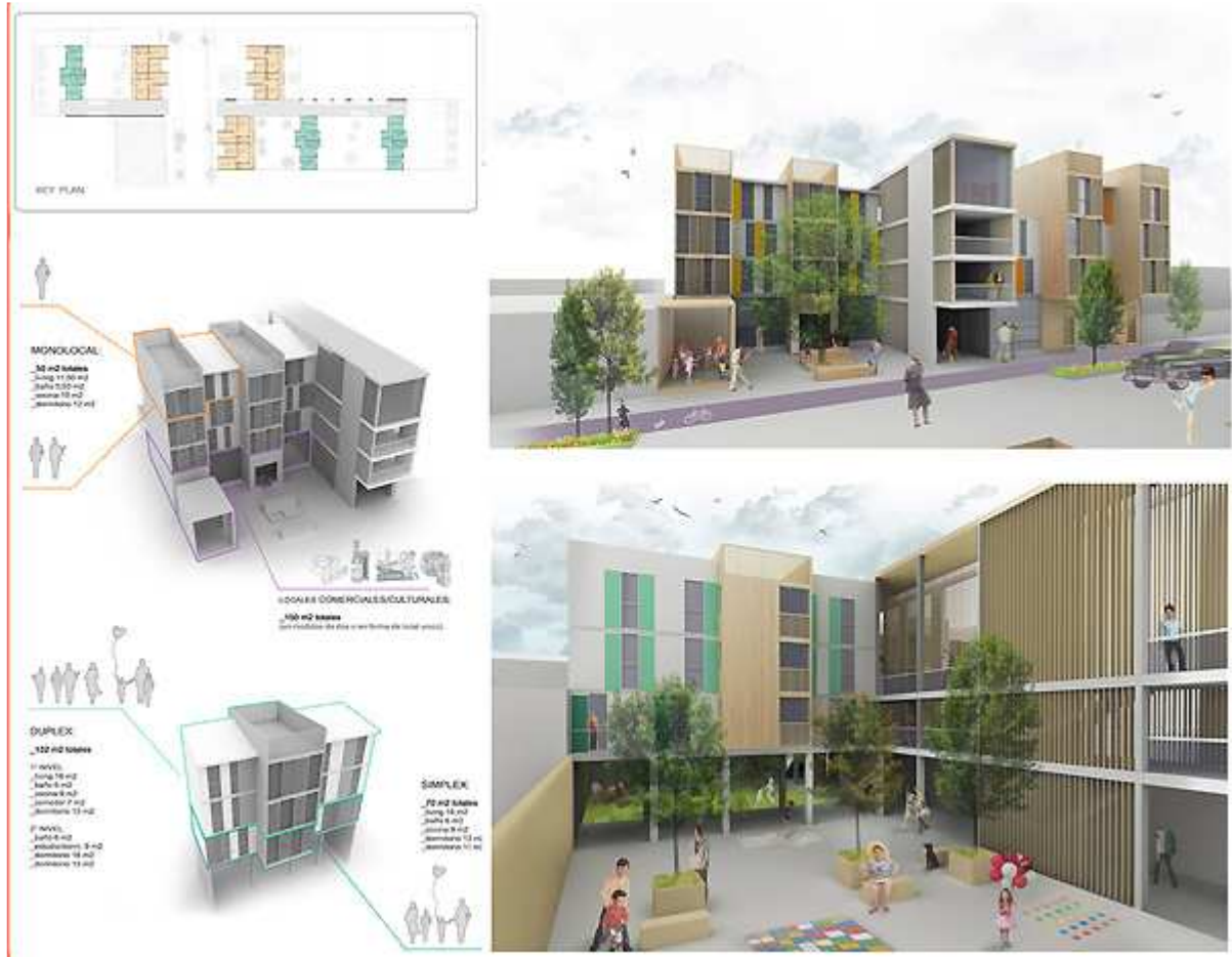
Visualizzazioni in 3D

Gli edifici del complesso che invece stanno sul fronte strada (con i locali commerciali al piano terra) sono pensati per un tipo di utenza più giovane (coppie o studenti/lavoratori) con appartamenti di 50 m 2 per un massimo di 3 persone.