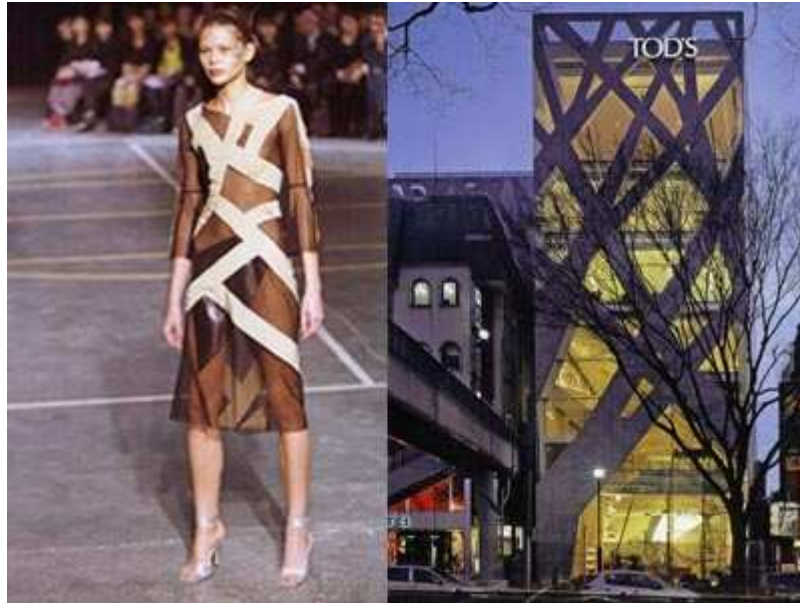
Way Dress by Yoshiaki Hishinuma of Tokyo, 2004 Tod's Omotesando building, Tokyo, 2004 Toyo Ito

Infatti anche in questa circostanza, la moda si è intrecciata con il lavoro di grandi architetti, impegnati nelle grandi esposizioni di inizio novecento, in cui emerse il lavoro delle rinomate sartorie torinesi dell'epoca, le quali presentavano le loro creazioni. Sarà proprio questo grande "successo" della moda italiana a Torino, che vedrà molti architetti tra i più noti del periodo, redarre le linee guida per la realizzazione di nuovi negozi che dovevano rispondere alle nuove esigenze e alle nuove tendenze del periodo.