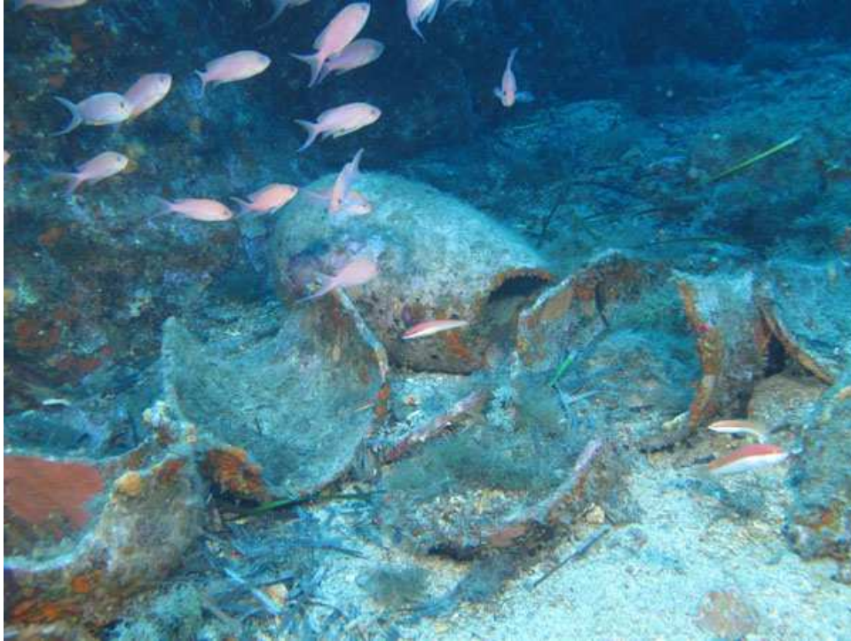
Anfore custodite nel sito archeologico sommerso di Capo Graziano

La ricerca ha evidenziato sia le connessioni e le similitudini che legano la tutela dei resti subacquei a quella del patrimonio archeologico terrestre, sia le caratteristiche che, a partire dal medium , ne fanno un settore di studi aperto e innovativo, oltre che di grande interesse e rilevanza.