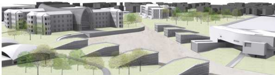
Vista della piazza

Su di essa si affacciano una serie di maniche semi-interrate che completano questo sistema integrato formato da aree pavimentate, aree a verde ed edifici.