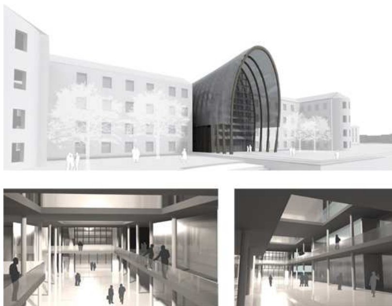
Viste della galleria coperta

L'idea per la trasformazione è stata quella di sostituirla il corpo centrale con una galleria coperta che alla scala della città connettesse il parco in progetto con quello esistente e a quella dell'edificio distribuisse le varie funzioni che sono state collocate al suo interno. In un contesto così problematico, la scelta è stata quella di intervenire a partire dall'esistente, avendo ben chiaro che si tratta di un polo destinato ai giovani. I quali si spera possano in futuro, attraverso la conoscenza del passato e una maggiore consapevolezza, perseguire le vie del dialogo della collaborazione, che sono così necessarie per la ricucitura del territorio.