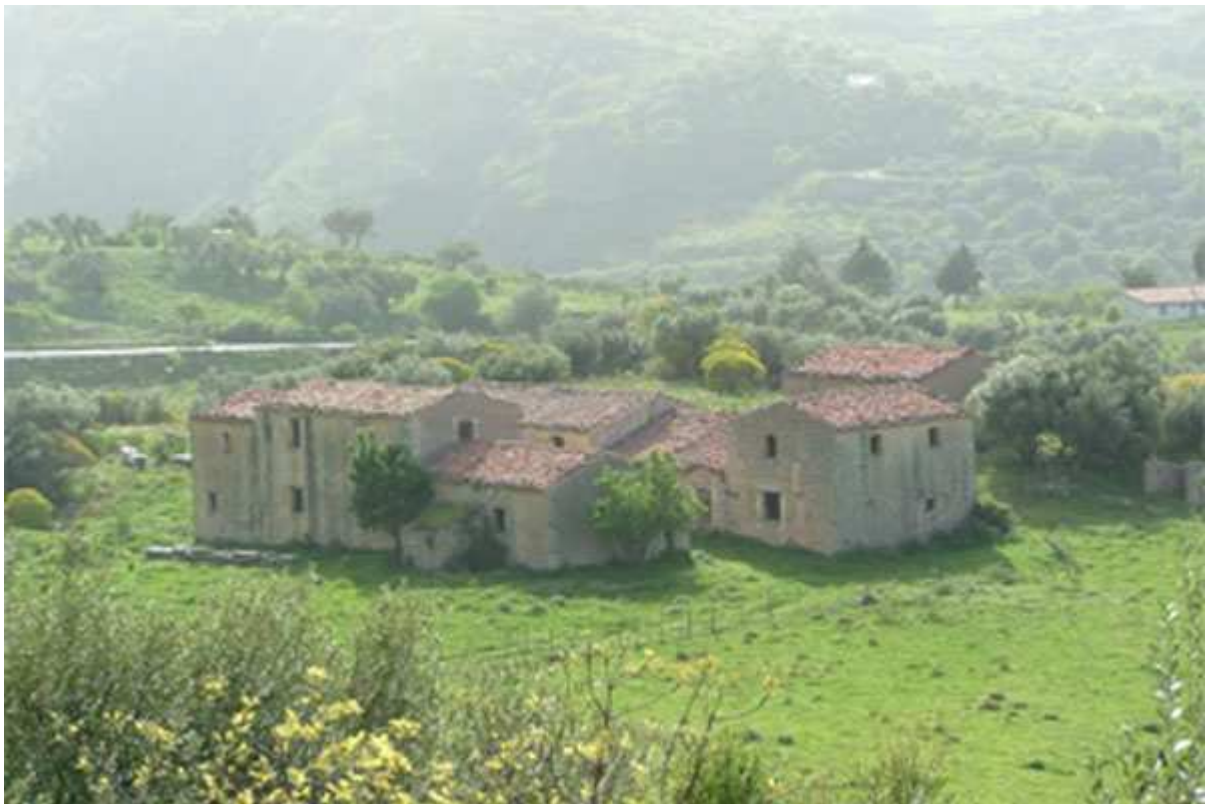
Foto Masseria Aquileia

Il tema oggetto di studio è la “ Masseria Aquileia ”, esempio di Architettura Rurale sita tra il Comune di Castelbuono e quello di Isnello, nel cuore del Parco Naturale delle Madonie in provincia di Palermo.