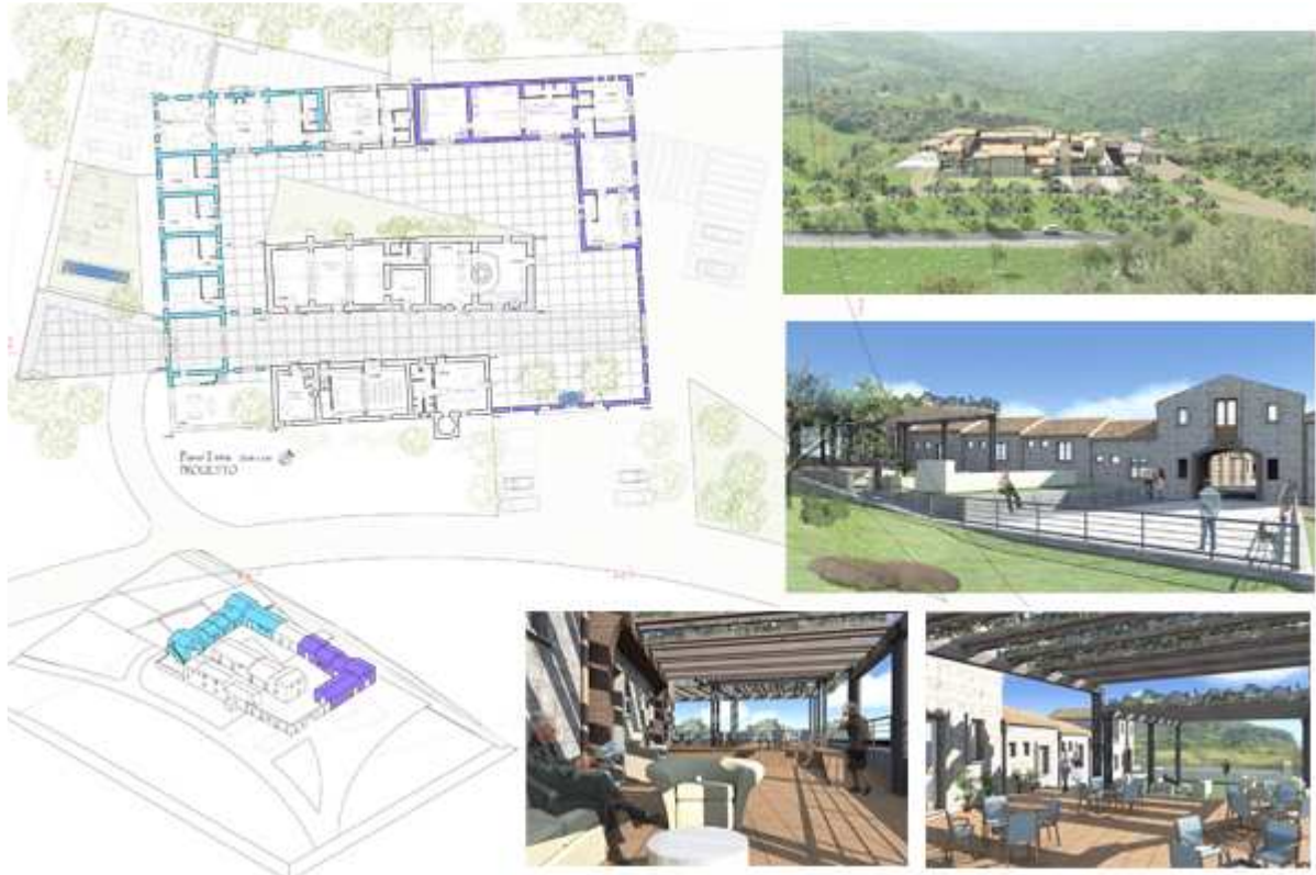
Architettonico di Progetto con 3d e Rendering di Progetto

Dal punto di vista architettonico l'introduzione di nuove funzioni ha necessitato un ampliamento di volumetria, ciò è stato fatto tenendo conto che l'attuale conformazione è dissimile dall'impianto tipologico della Masseria, pertanto in fase di composizione architettonica si è scelto di donare un impianto chiuso su quattro lati introducendo due nuovi volumi, quello a Nord per la funzione Produttiva quello a Sud per la funzione Ricettiva.