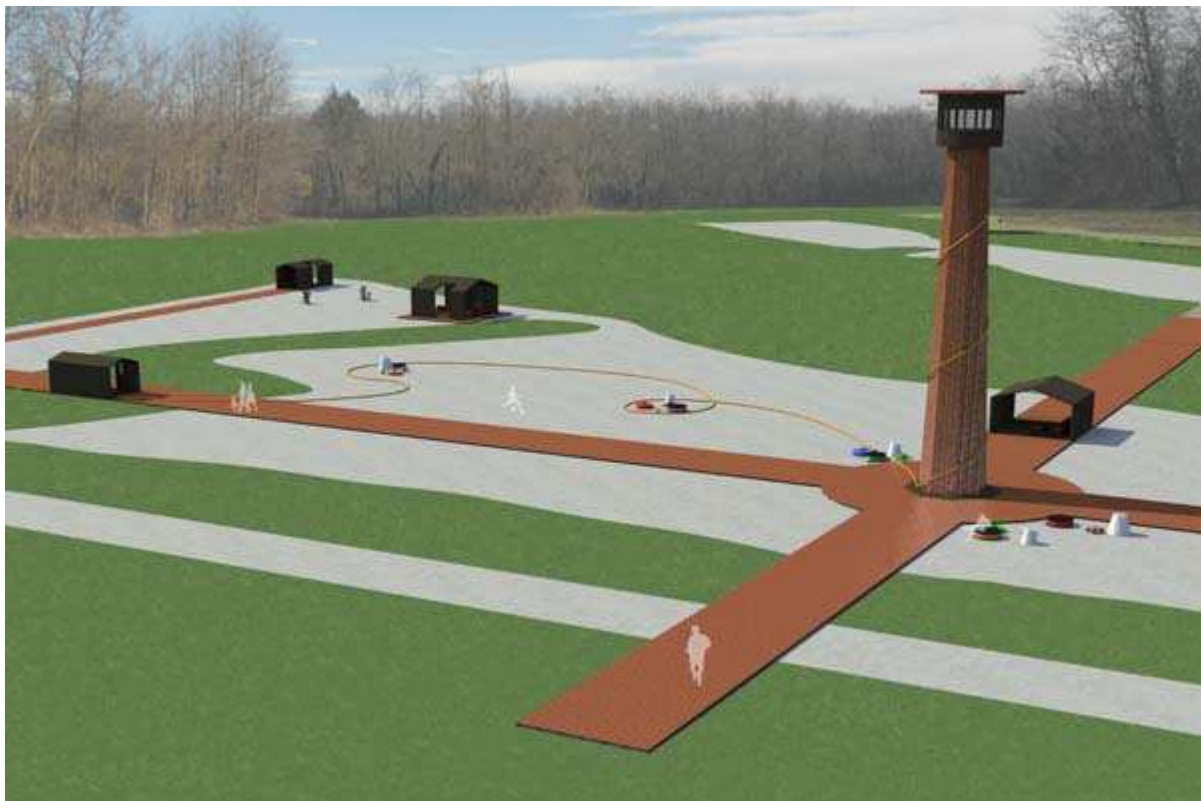
Rendering del progetto