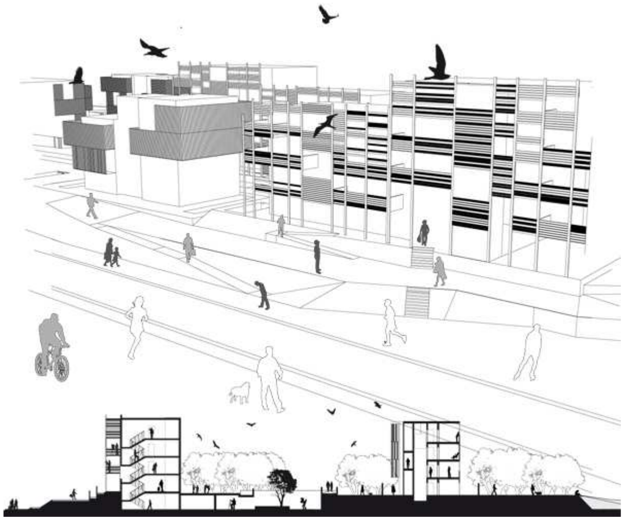
Section et perspective d'une bande de résidentiel