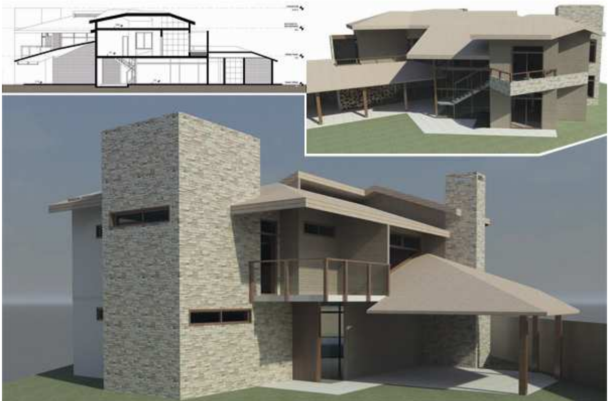
Sezione e Prospettive