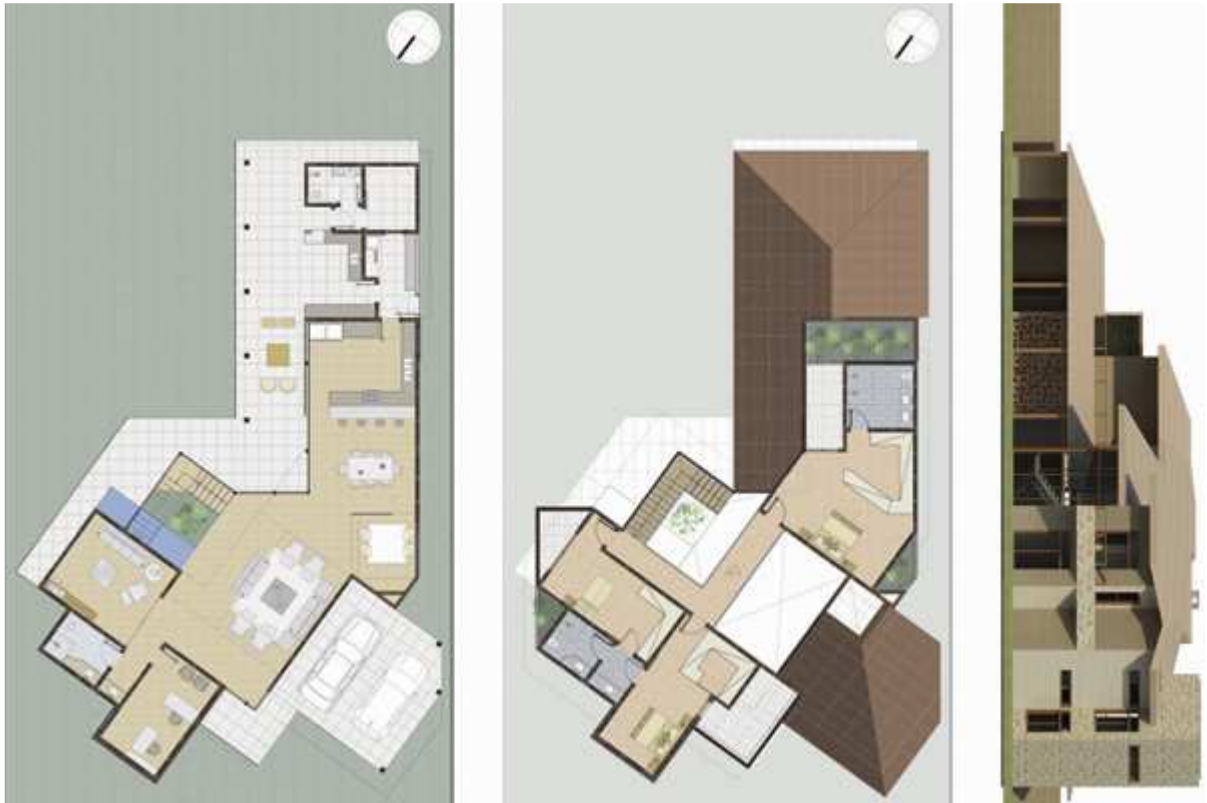
Planimetrie e Facciata Nordest