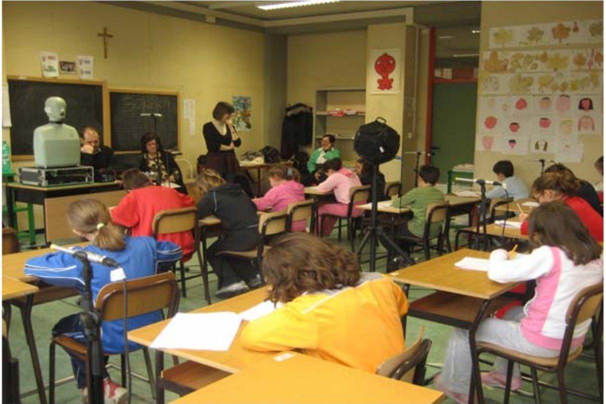
Figura 1 – Aula laboratorio della scuola A. Manzoni durante lo svolgimento di un test di intelligibilità

I risultati ottenuti mostrano che l'intelligibilità aumenta con l'aumentare dell'età scolare; i bambini di 2a elementare comprendono una percentuale di parole inferiore rispetto ai bambini delle classi più avanzate.