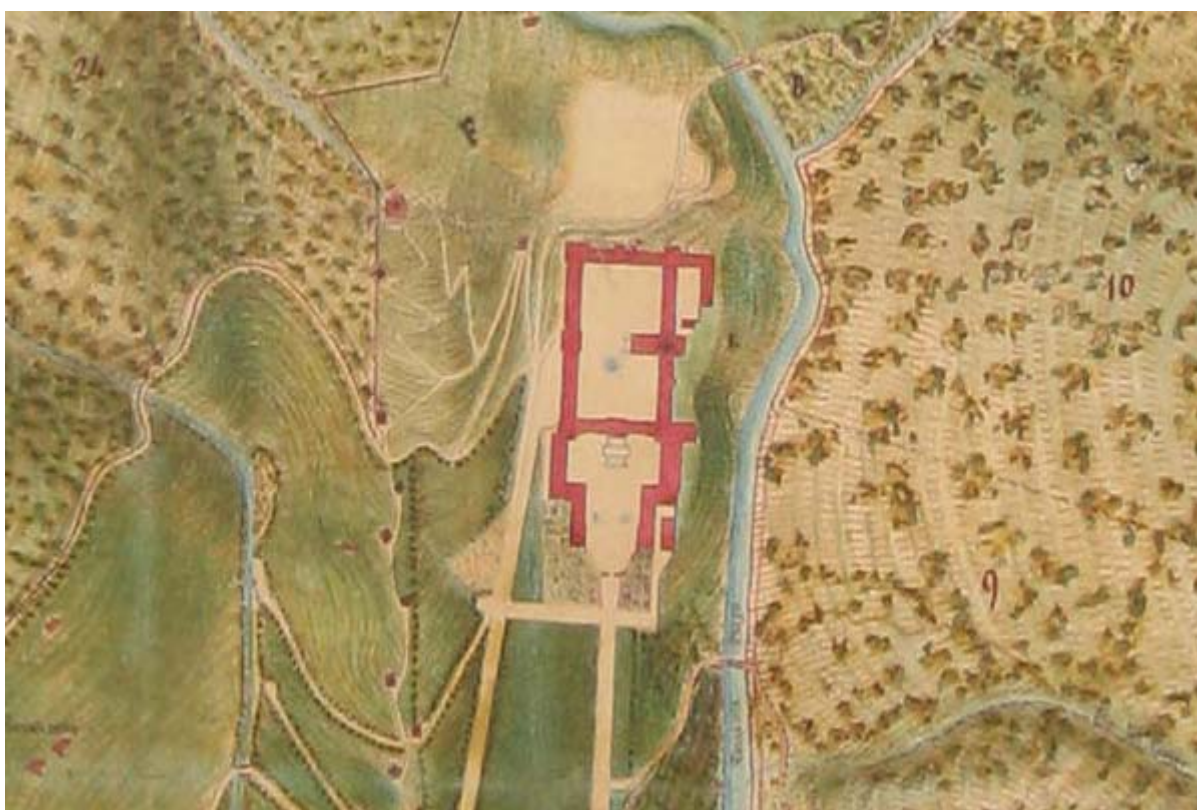
“Tipo Planimetrico dei Boschi propri del Santuario di Oropa” Ing. Tomaso Gavosto, 1857

Il lavoro di tesi di laurea intende ripercorrere e ricostruire quelle che sono state le modifiche e le trasformazioni avvenute e non sul territorio della Valle di Oropa, sia per quanto riguarda la Fabbrica del Santuario che per la sua orografia.