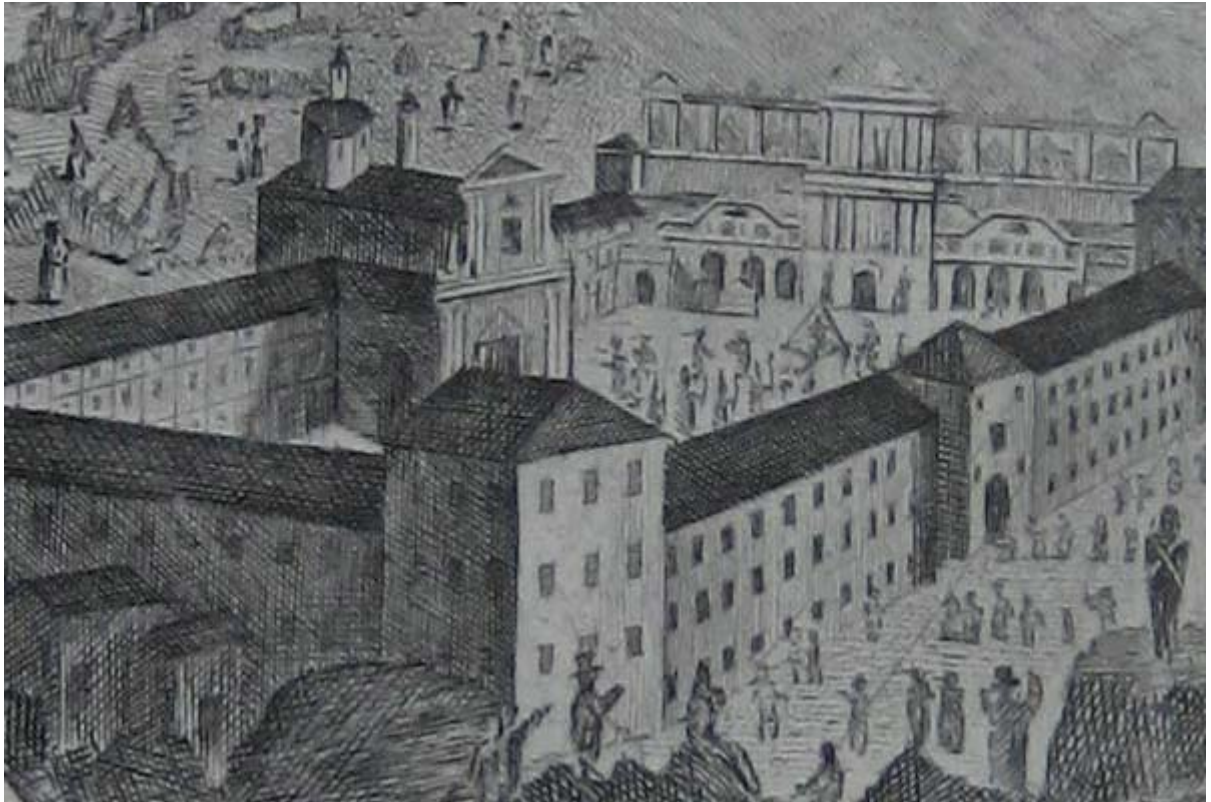
“La facciata interna del Santuario durante la Terza Incoronazione” Billotti Pietro Antonio – Monatti Domenico Klemi, 1820-21

L'obiettivo della mia ricerca è stato quello di restituire anche e soprattutto in maniera immediata e visivamente comunicativa, lo sviluppo nel tempo del Santuario. Per questo scopo mi sono servito di “tavole di sintesi” che riproducono l'intero lavoro in forma grafica attraverso l'uso dei colori ed immagini. La tesi è strutturata in tre grandi capitoli: Il Santuario di Oropa, Le Cappelle del Sacro Monte di Oropa, I Cimiteri di Oropa. Per ogni capitolo vi è una suddivisione interna in paragrafi, i quali rappresentano la periodizzazione interna del complesso politico-amministrativo di riferimento. Ogni paragrafo è infine suddiviso in capoversi che rappresentano gli interventi puntuali sul territorio, le costruzioni, le modifiche, i cambiamenti avvenuti e non per ogni periodo di riferimento.