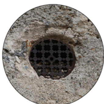
Particolare in ferro