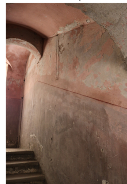
Particolare del corpo scala.

Il rilievo del piano terzo si affida completamente alle misurazioni compiute dall'ufficio tecnico di Banca Sella negli ultimi anni; infatti lo stato precario in cui si trovano i solai ha impedito un sopralluogo sicuro (i pavimenti sono in più punti crollati).