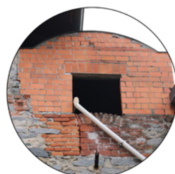
Mattoni forati e pieni