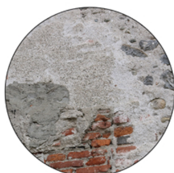
Particolare muratura (mattoni pieni, pietra, intonaco cementizio)