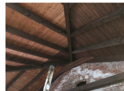
Fotografia del sottotetto che mostra la copertura di recente costruzione.