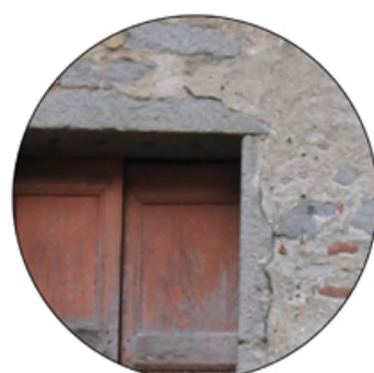
Legno e pietra