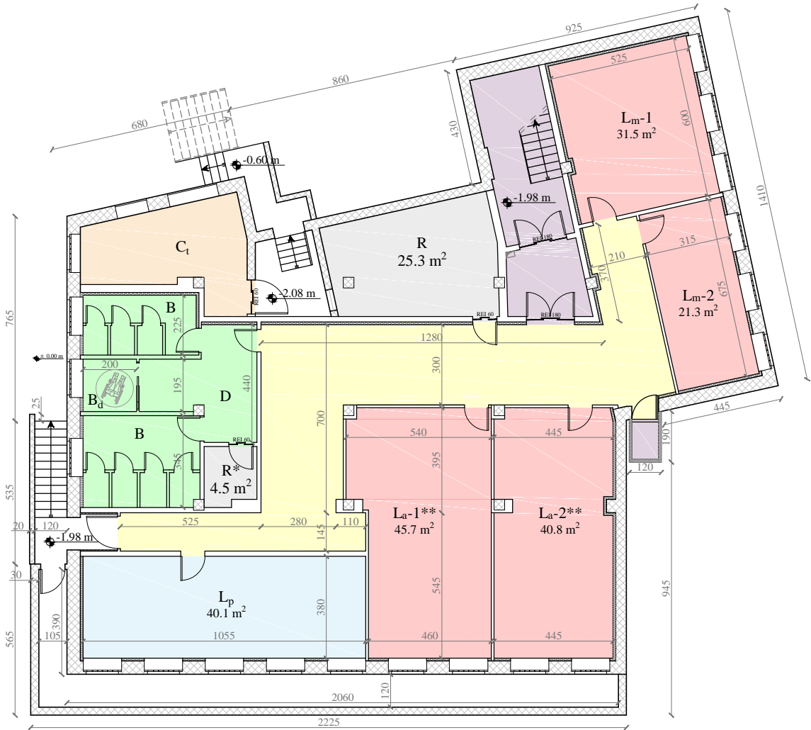
Pianta piano seminterrato scala 1:200

* locali con canale per l'aerazione naturale ** locali con sistema di ventilazione meccanica