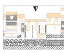
Prospetto lato scarpata