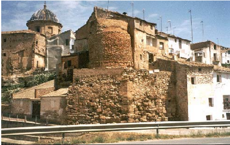
Requena, ruinas de la antigua muralla arabe

La ciudad de Requena se encuentra a unos 70 Km de Valencia, junto a la autovía A3 Valencia – Madrid; fue una avanzada militar a partir de Al-Andalus y tuvo hasta nuestros días un importante nudo comercial, debido a su posición fronteriza entre la meseta central y la huerta valenciana.