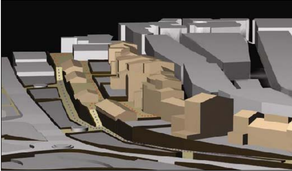
La Spina y su roca en el nuevo proyecto

Este trabajo final de carrera quiere ser un estímulo para recalificar la Spina , la roca y el barrio entero de Las Peñas , guardando sus valores históricos, arquitectónicos y ambientales e intentando aportar nueva vida.