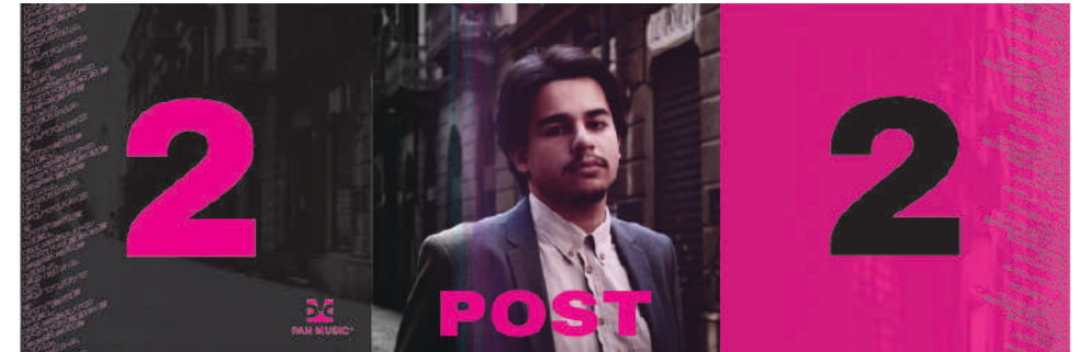
Trittico di grafiche per il lancio di POST vol.2 .