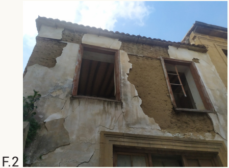
F.2 Imantosis alla quota degli architravi delle aperture.