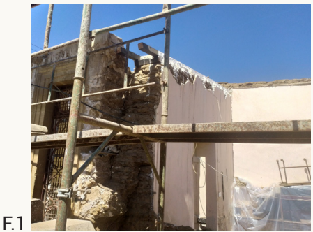
F.1 Imantosis alla quota della cimasa (o dell'interpiano).