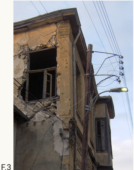
F.3 Muro a telaio esterno connesso al muro della facciata principale in pietra.