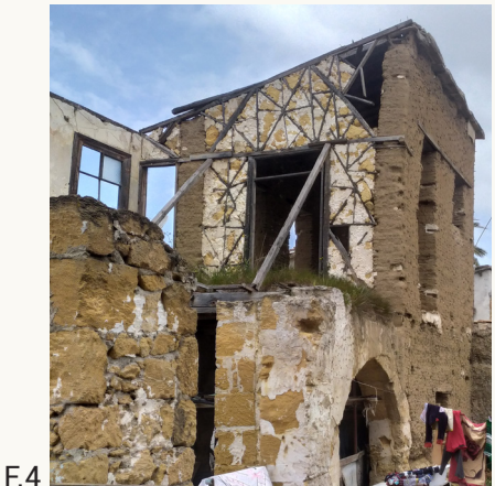
F.4 Muro a telaio interno connesso ai muri in mattoni di fango perimetrali e collegato con la tecnica dell'imantosis all'altezza dell'apertura.