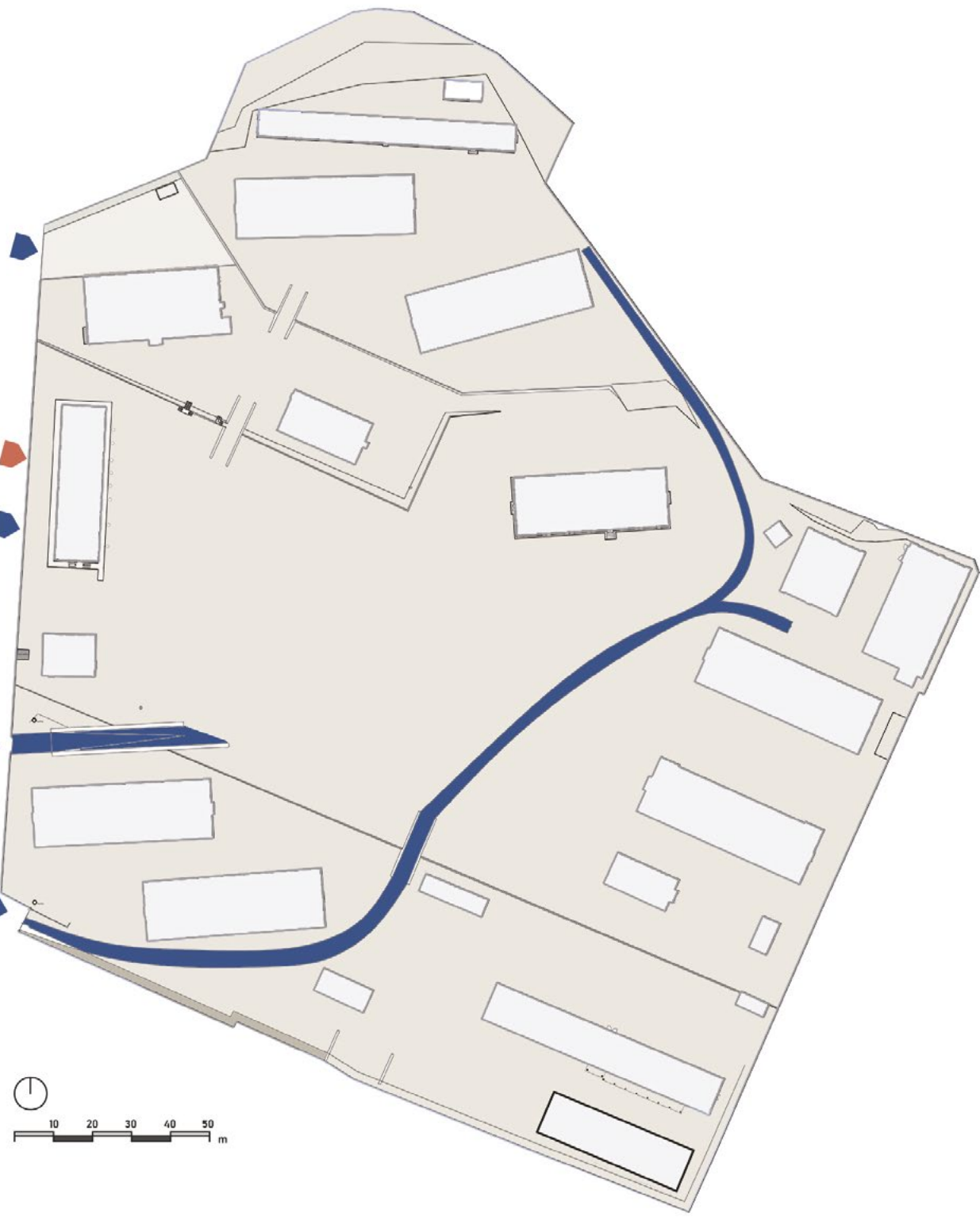
Viabilità interna al lotto accessi carrabili (blu) e pedonale (arancione)