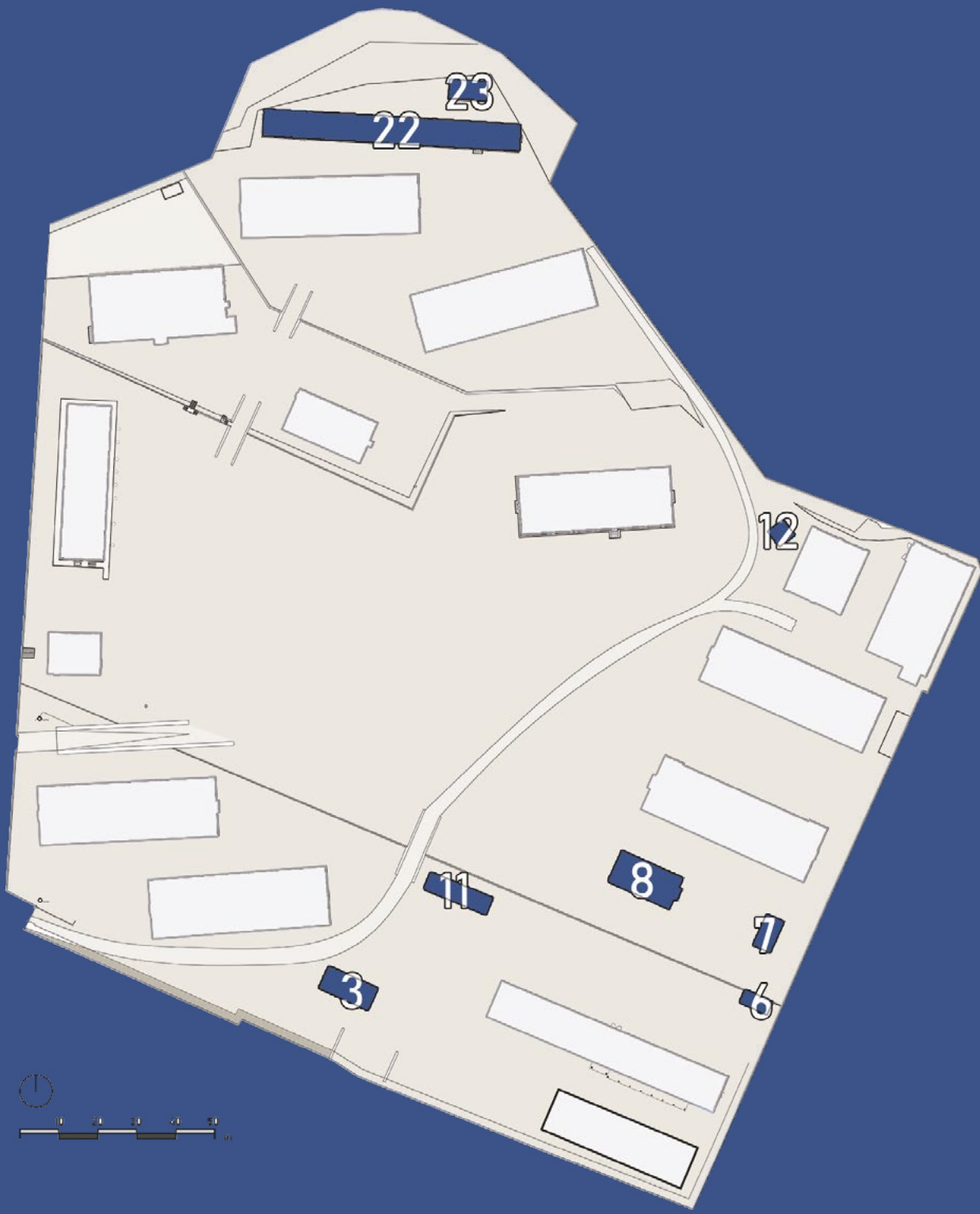
Edifici con funzioni di servizio secondarie (3-8-23 bagni e docce, 6-7-11-12-22 magazzini)