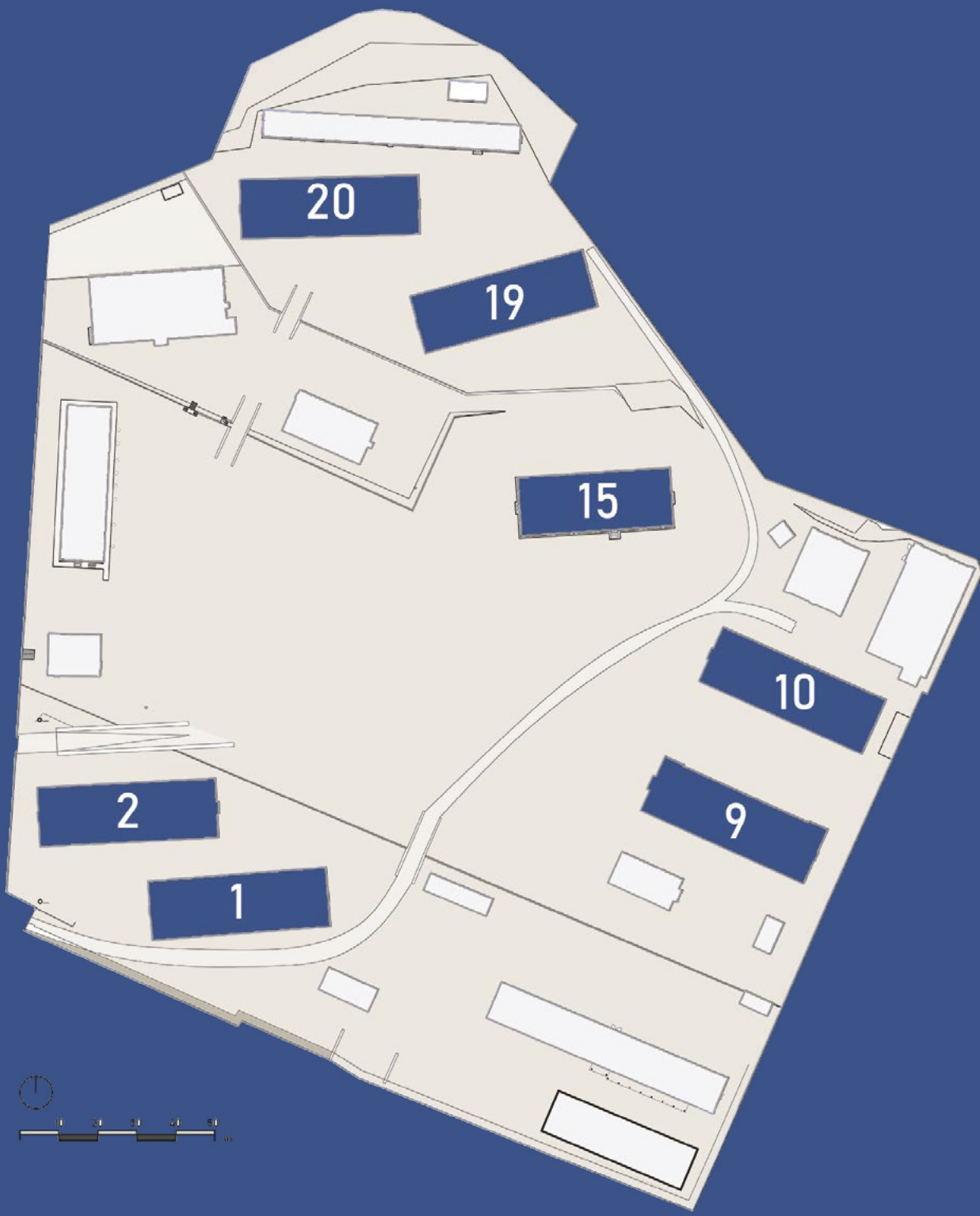
Edifici con funzione di camerata