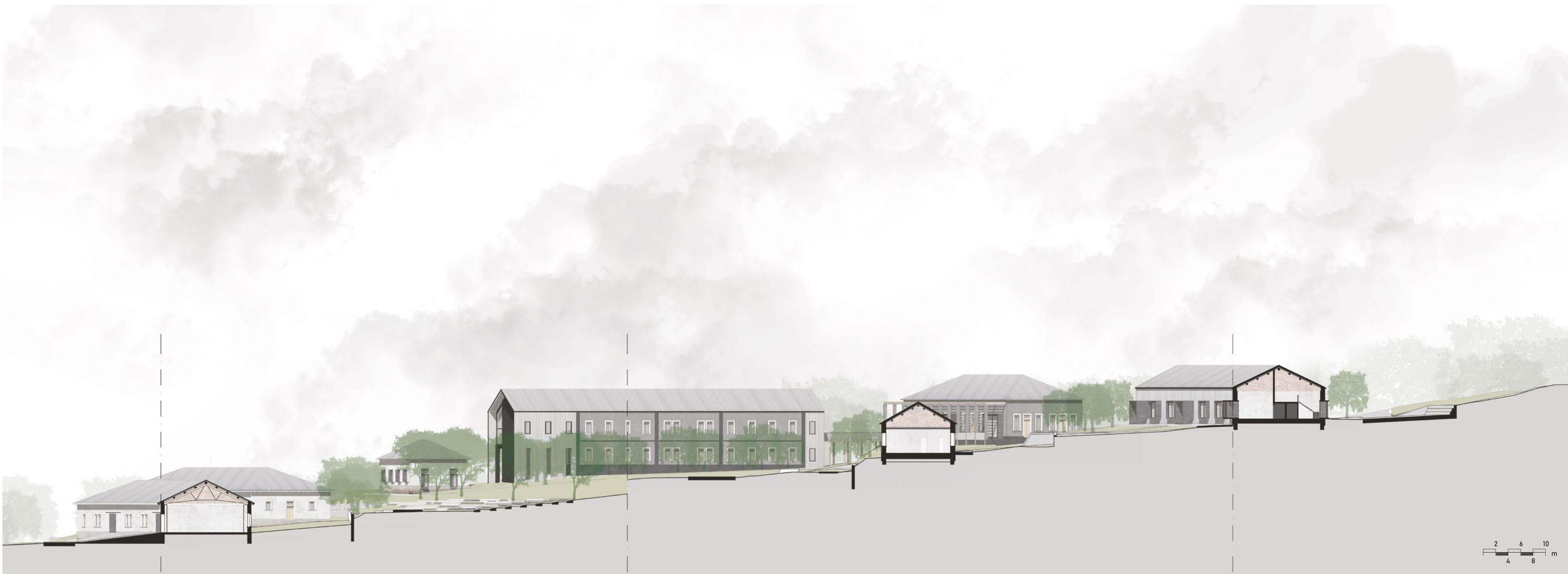
Sezione territoriale BB'