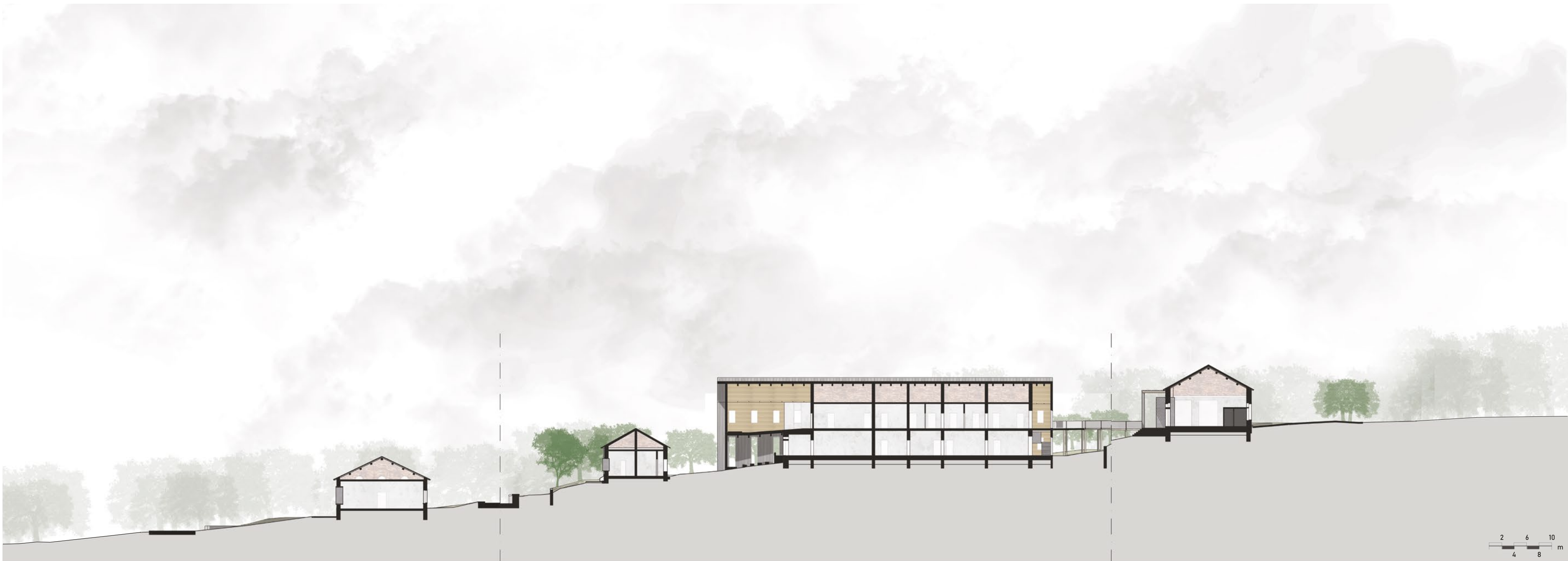
Sezione territoriale AA'