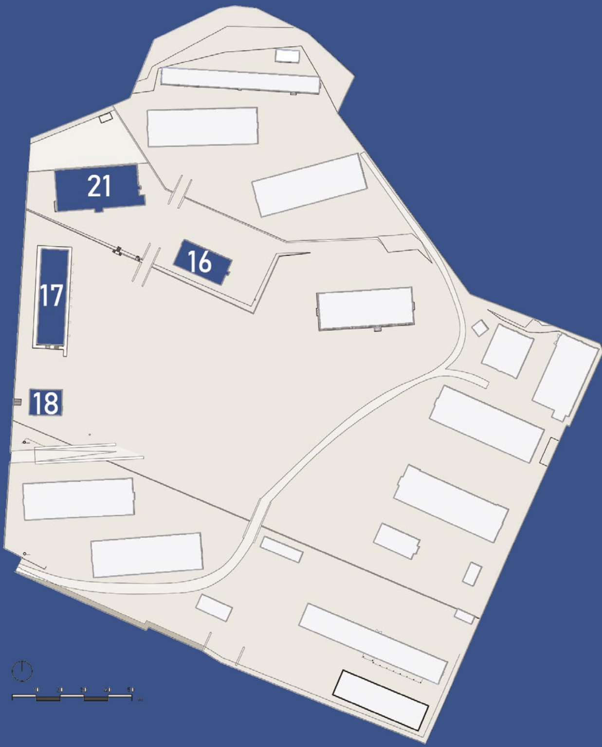
Edifici con funzioni di servizio principali (16 infermeria, 17 comando, 18 carceri, 21 cucine)