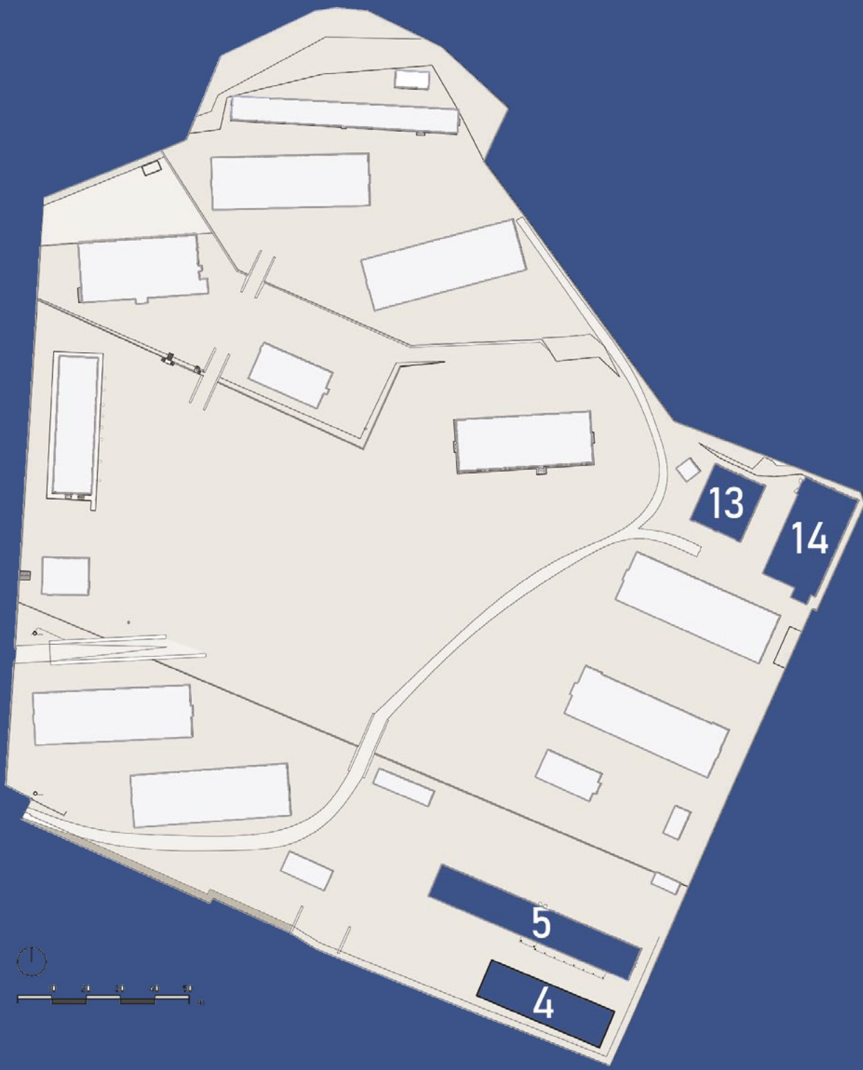
Edifici con funzioni di ricovero animali (4,5) e mezzi (13,14)