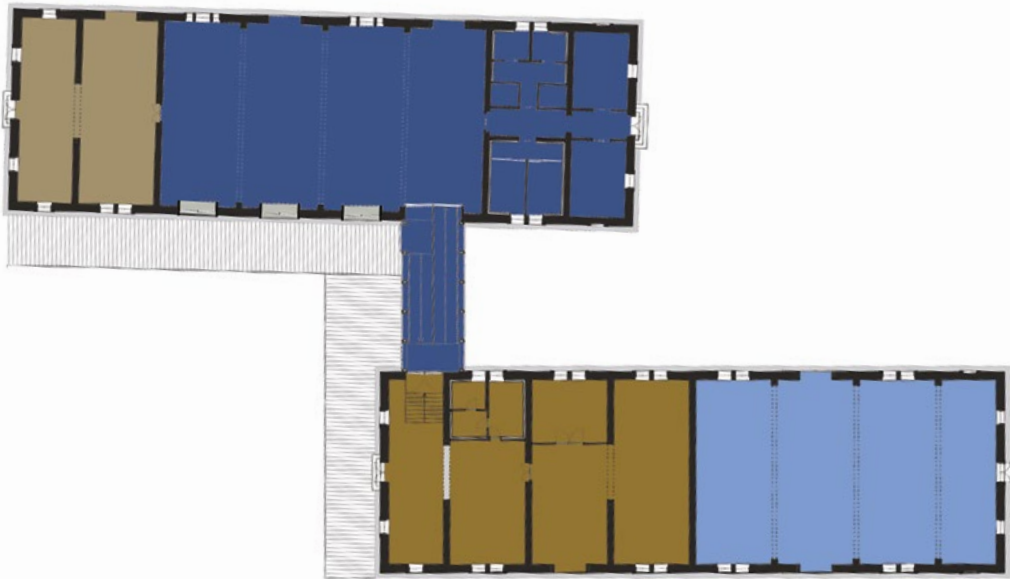
Edifici 1 e 2 - Piano funzionale mercato e produttivo