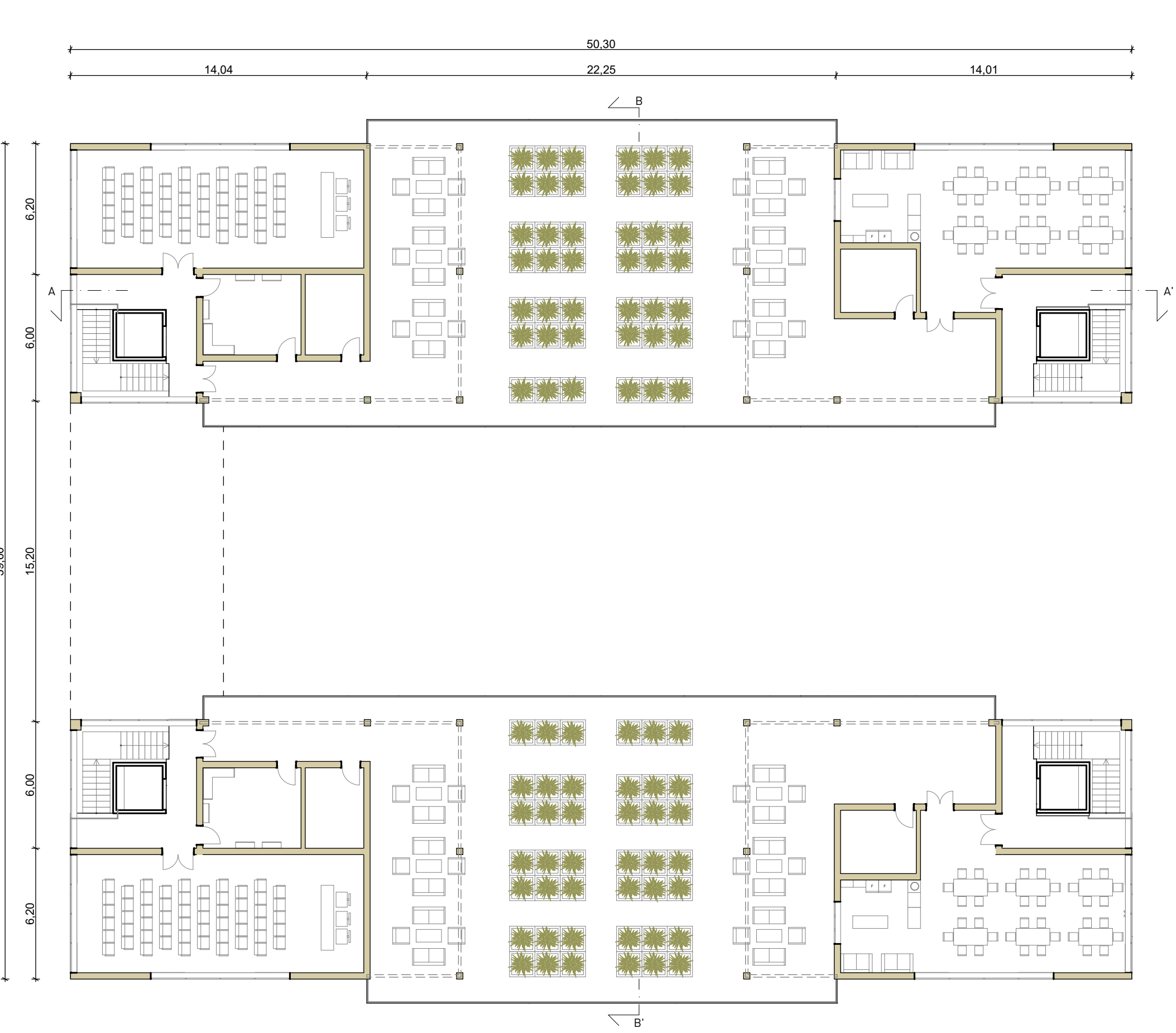
PIANTA QUINTO PIANO (SCALA 1:200)