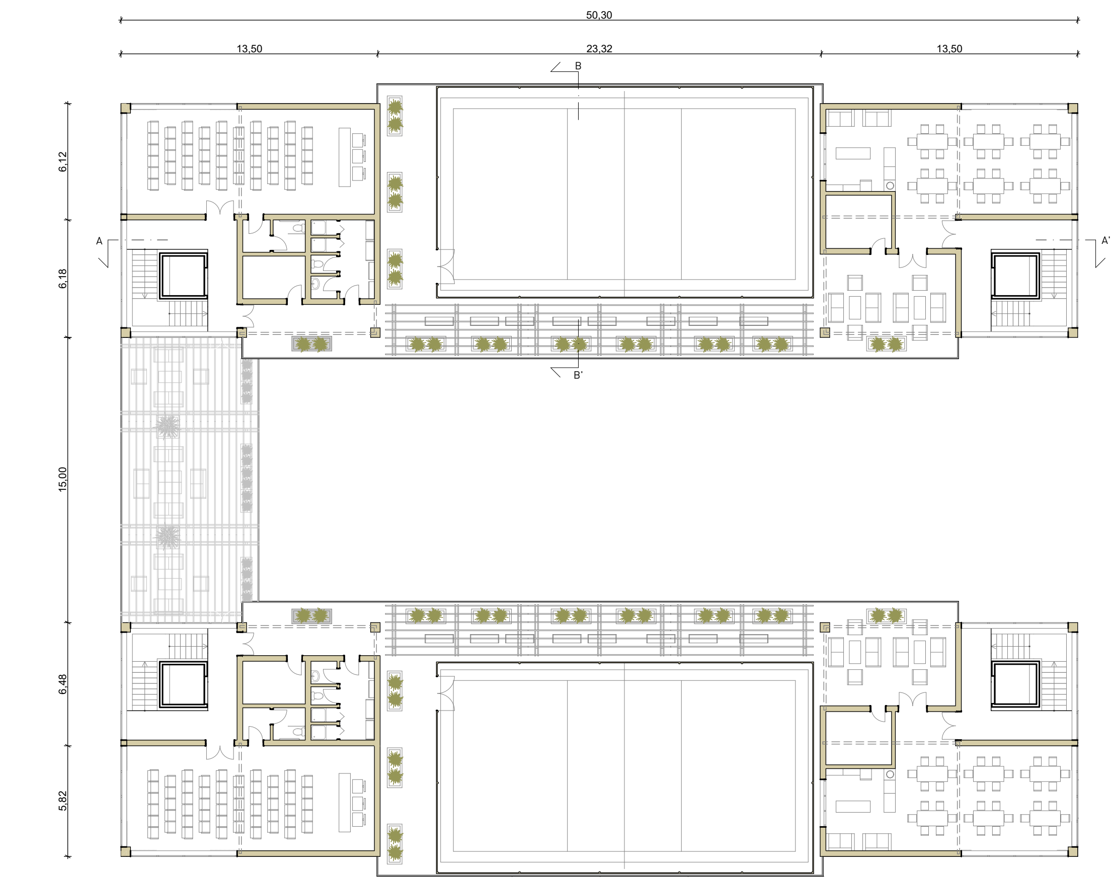
PIANTA QUINTO PIANO [SCALA 1:200]