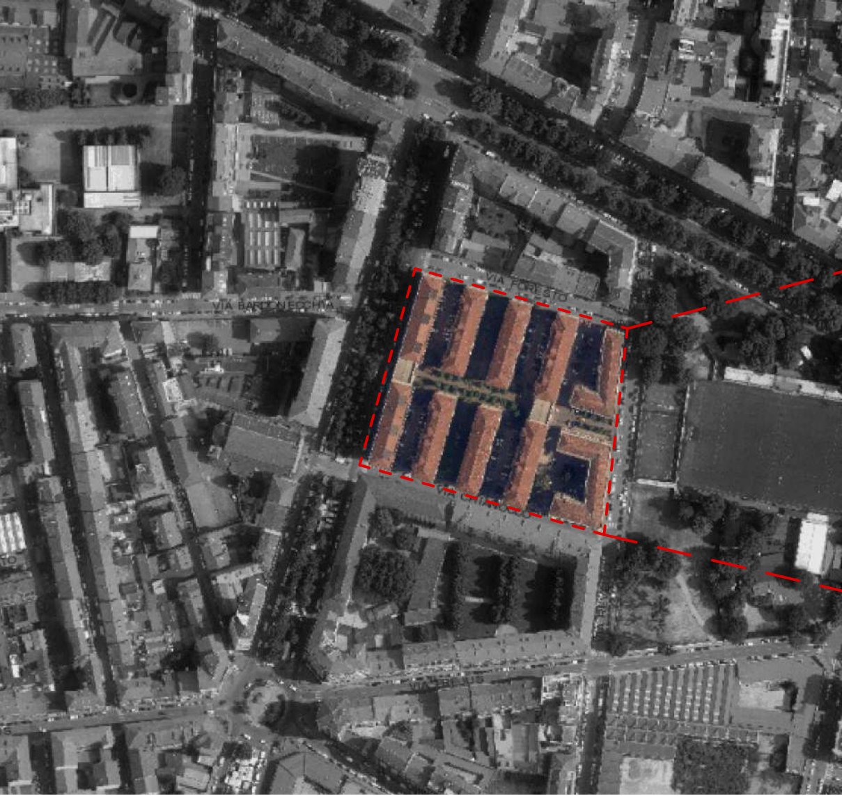
INQUADRAMENTO DELL'AREA DI PROGETTO