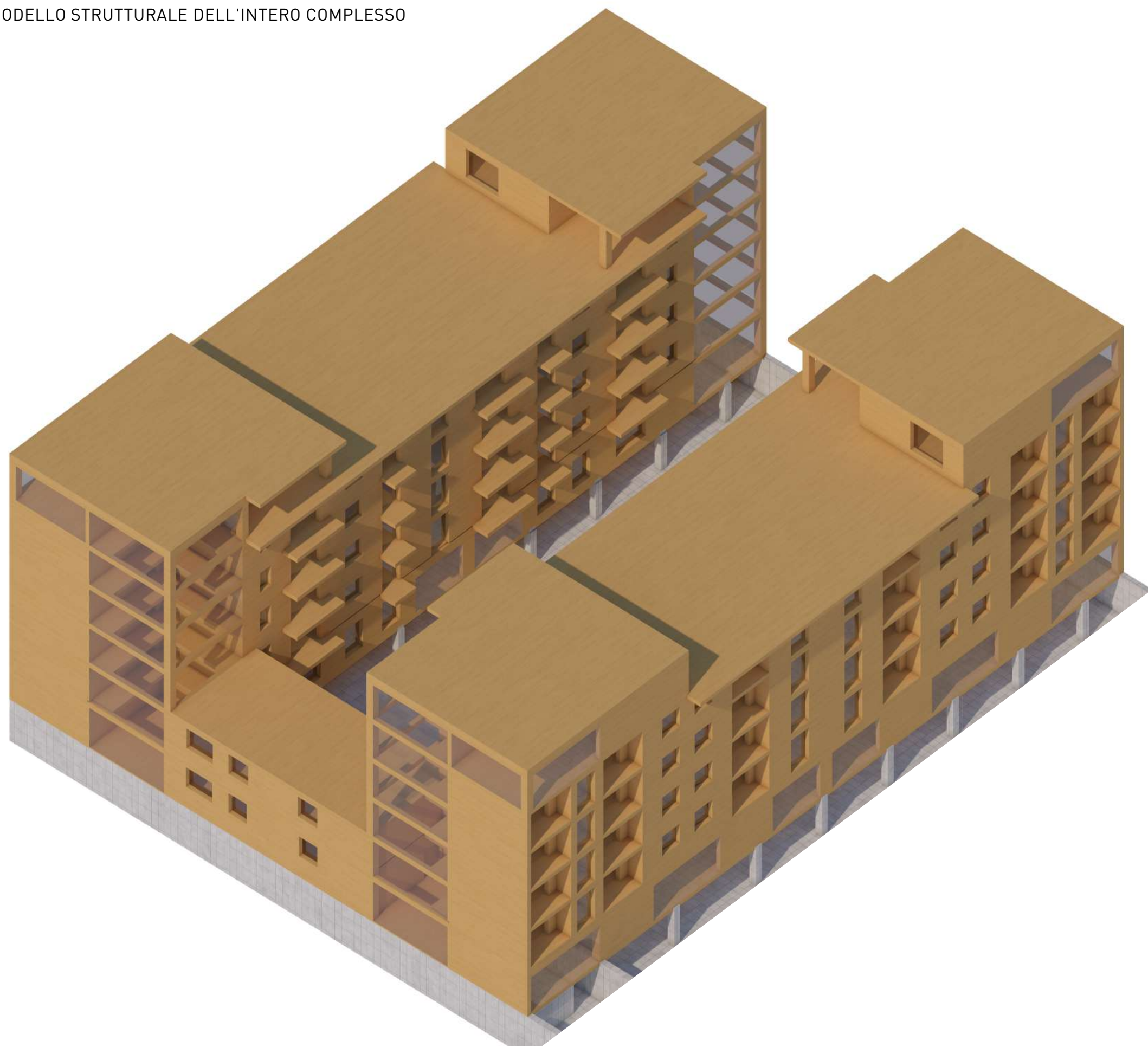
MODELLO STRUTTURALE DELL'INTERO COMPLESSO