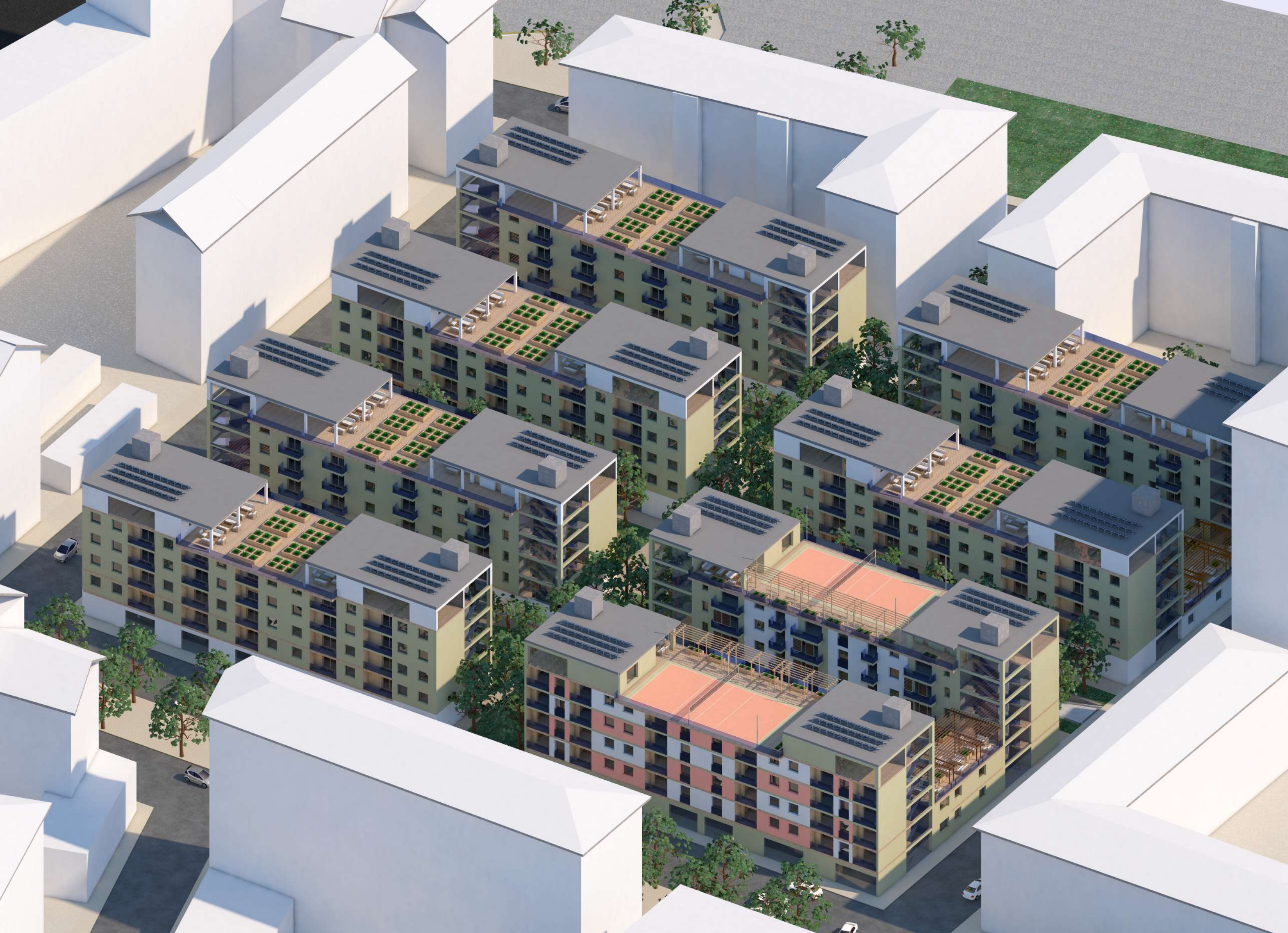
VISTA ASSONOMETRICA DEL LOTTO DI PROGETTO