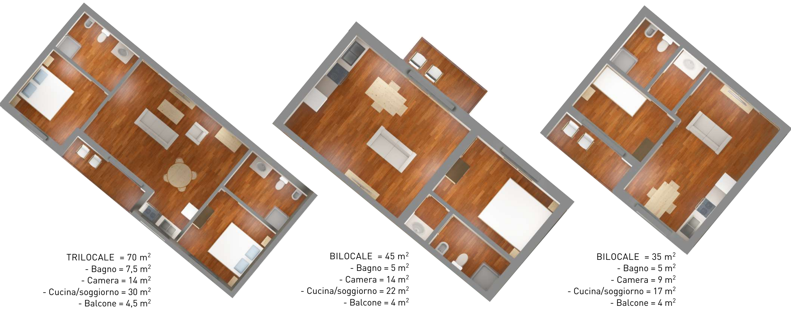
TIPOLOGIE CAMERE (fuori scala)