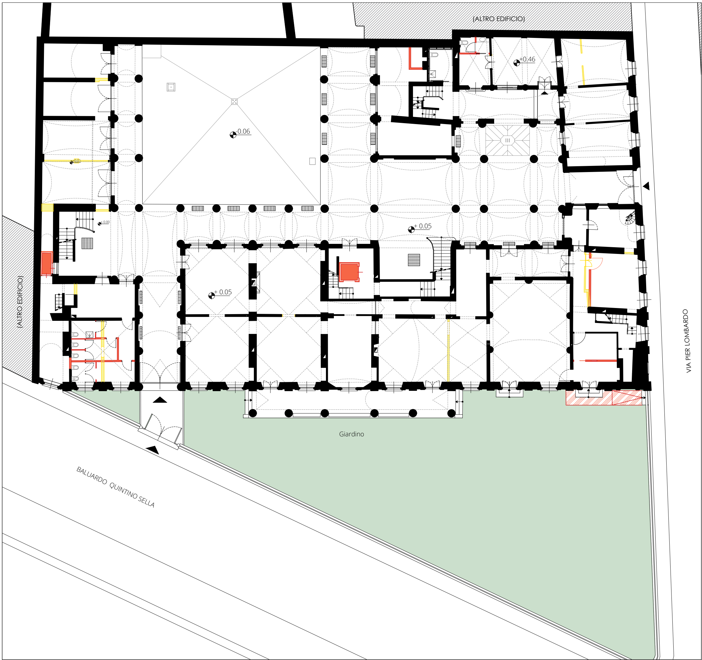
Codifica e dimensioni degli ambienti