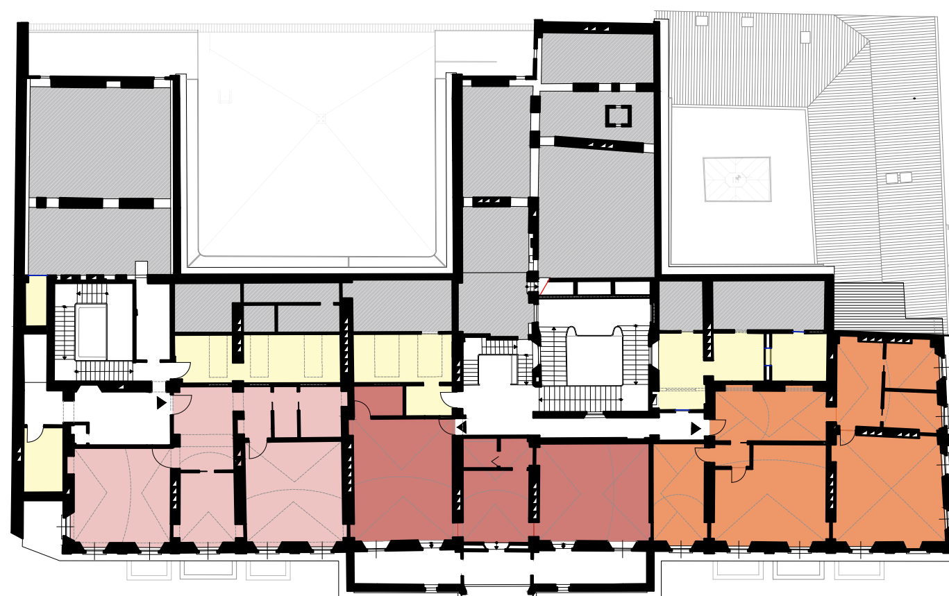
Keyplan Piano Terzo